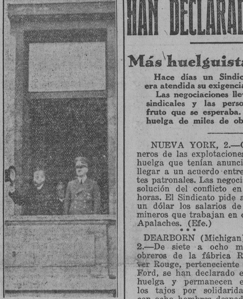
El enviado especial del Japón y ministro de Relaciones Exteriores de aquel país, Matsuo, acompañado por el Führer, recibe las aclamaciones del pueblo alemán con motivo de su visita a Berlín.

BUDAPEST, 2. (S. E. T.)—Los círculos políticos de la capital húngara consideran la situación en Yugoslavia como extraordinariamente grave. Llama poderosamente la atención el hecho de que el Go-