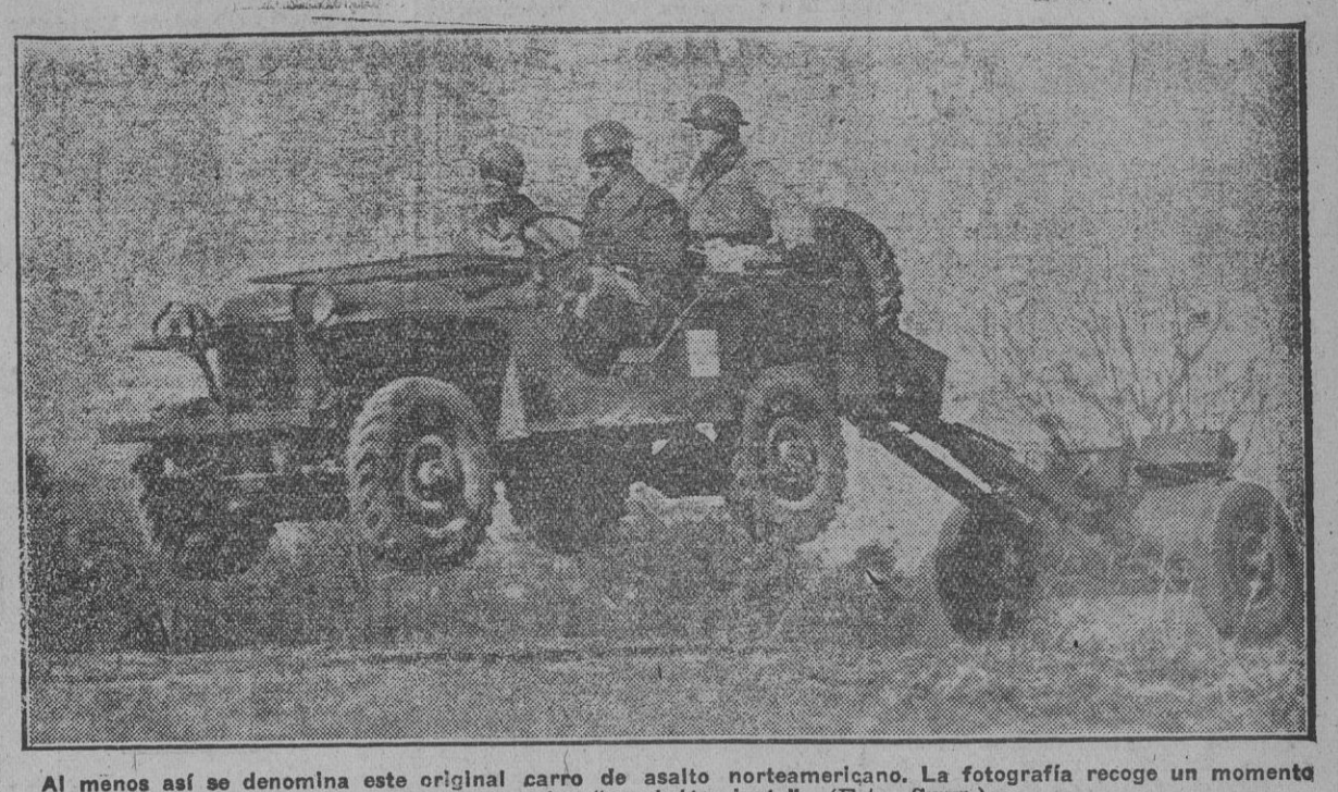
Al menos así se denomina este original carro de asalto norteamericano. La fotografía recoge un momento interesante de "encabritamiento".