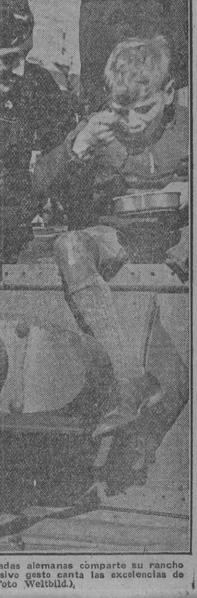
Un soldado de las divisiones blindadas alemanas comparte su rancho con un chicleto, que con su expresivo gesto canta las excelencias de la comida.