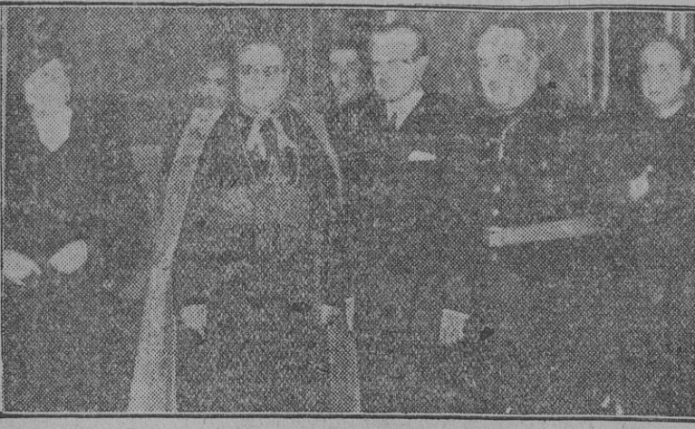
El ministro Presidente de la Junta Política, el nuncio de Su Santidad, el alcalde de Madrid y otras autoridades, en la recepción celebrada ayer en el Ayuntamiento de Madrid.