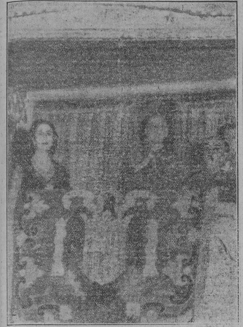
Su Excelencia el Jefe del Estado, acompañado de su esposa, en la función de gala celebrada anoche en el teatro Español.