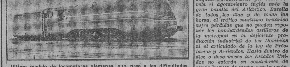
Último modelo de locomotoras alemanas, que, pese a las dificultades de la guerra, se construyen actualmente para la mayor rapidez en los servicios germánicos.