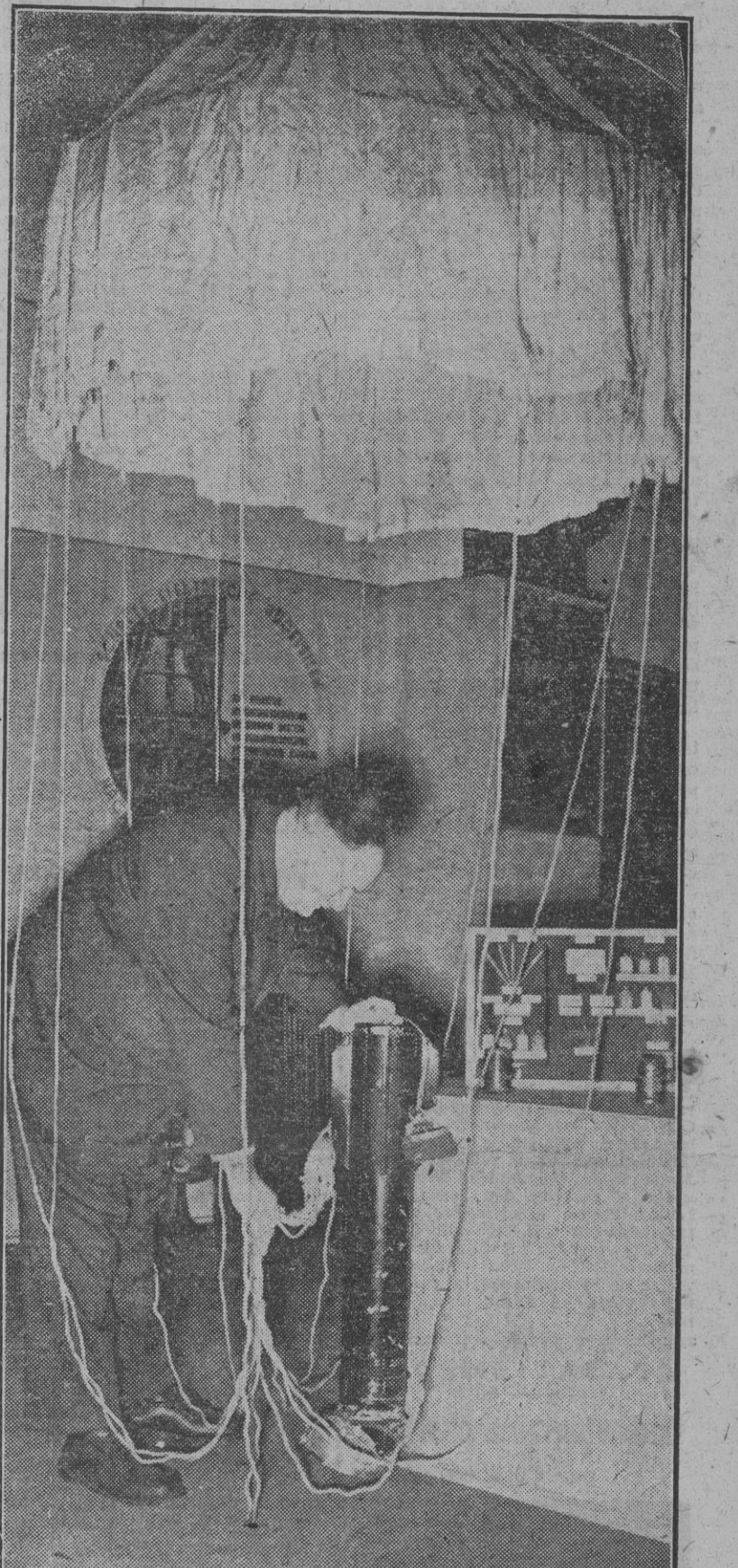
Alguna vez los hombres nos hemos emocionado ante el paso de un meteorito por el infinito ámbito del cielo. Su ráfaga luminosa tal vez nos haya inquietado. Pero el genio humano lleva hasta la práctica lo que en tiempos remotos hubiéramos creído privilegio de la Naturaleza. Hoy, nuevos meteoros cruzan el espacio: las potentes y destructoras bombas. Esta del grabado es una bomba luminosa con paracaídas.