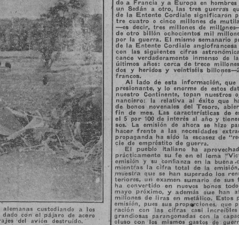
He aquí lo que ha quedado de un avión de caza inglés. Voló sobre tierras alemanas custodiado por los bombarderos de tiro avión, o tal vez la D. C. A. alemana, ha dado con el pájaro de acero en el suelo. Varios soldados especializados observan los retorcidos herrajes del avión destruido.