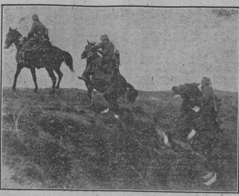
Cuando se pensaba que las modernas armas iban a desplazar por completo al noble bruto de sus servicios al hombre en la guerra, he aquí que el Arma de Caballería cumple, como siempre, uno de los principales cometidos de su estrategia. La foto representa una descubierta iniciada por los soldados de un pelotón auxiliar de reconocimiento, que opera conjuntamente con una batería de artillería pesada.