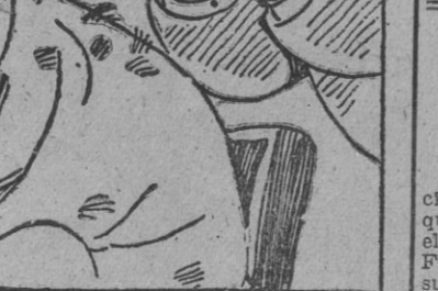
«¡Qué barbaridad! ¡Con el frío que hace te pones bajo el cerol...»