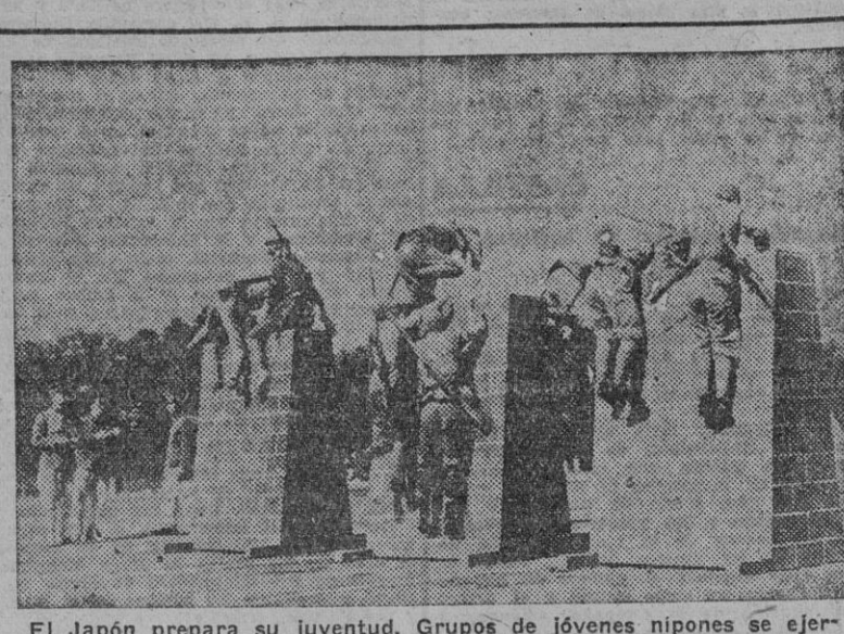
El Japón prepara su juventud. Grupos de jóvenes nipones se ejercitan en prácticas de disciplina y formación para fortalecer su cuerpo y su espíritu.