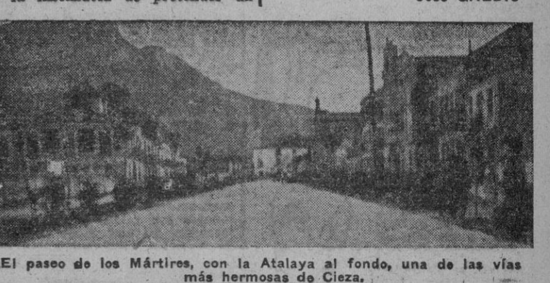
El paseo de los Mártires, con la Atalaya al fondo, una de las vías más hermosas de Cieza.

Claro es que no vamos a caer en la insensatez de pretender un