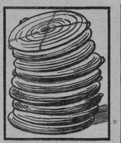
Industrias, la del papel, por ejemplo, que nos apremian constantemente con la urgencia de la mercadería nuestra, que precisan para que sus talleres no paren, y nosotros nos vemos impotentes para resolver la cuestión, que sólo con vagones en circulación para el transporte de nuestros productos podría remediarse.

Importancia económica y social de la industria.—Momentos de florecimiento y momentos de crisis.—Sus necesidades de transporte ferroviario.—Sus demandas de energía eléctrica.—Conveniencia de evitar el paro