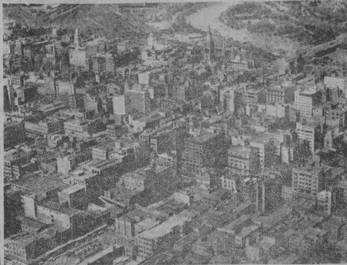
Una vista de la bella ciudad de Melbourne, escenario de la Olimpiada de 1956. Situada en las alturas, cuando en Barcelona son las 12 del día, en Melbourne son las 11 de la noche.

Las pruebas de mediodía y fondo, serán indudablemente la máxima atracción de los Juegos, tanto por la calidad de los atletas que se preparan a tomar la salida, como por la igualdad de sus marcas, que hacen no se vea un claro vencedor.