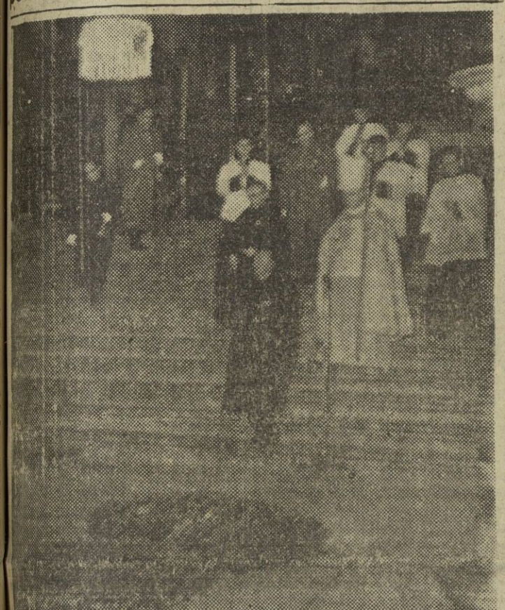
Lorenzo del Escorial.—S. E. el Jefe del Estado abandonó el altar desde el cual presidió el solemne funeral por el alma del Fundador en el templo del monasterio.

El Caudillo presidió el funeral por el alma de José Antonio