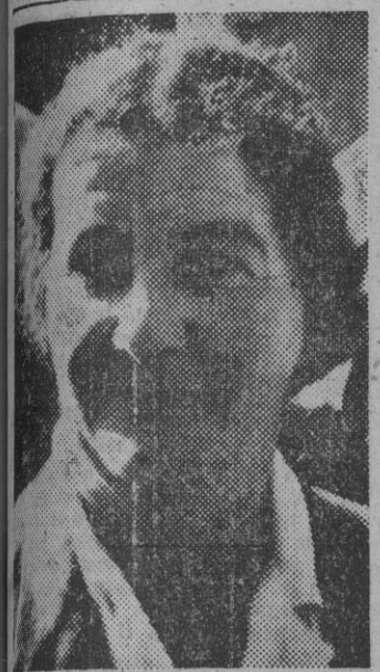
Moshe Sharet, hasta ahora ministro de Asuntos Exteriores de Israel, ha presentado su dimisión en Telaviv. Le reemplazará en el cargo la señora Golda Meyer, que ocupaba la cartera de Trabajo.

El nuevo ministro israelí de Asuntos Exteriores