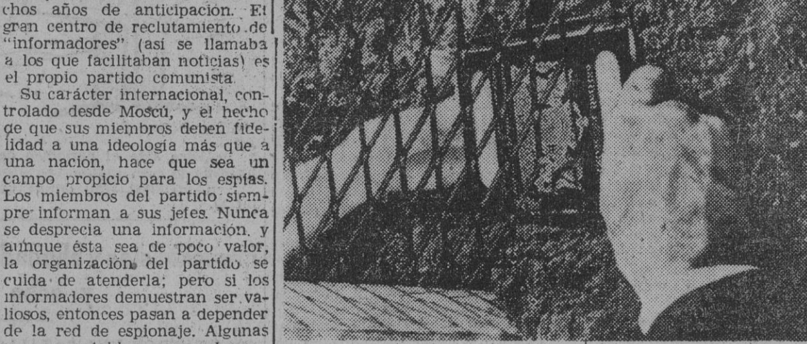
El cambio que daba a un hombre, nuevo nombre y nueva vida. Pasaportes para cubrir desapariciones eran usualmente obtenidos por un miembro comunista en la oficina de pasaportes