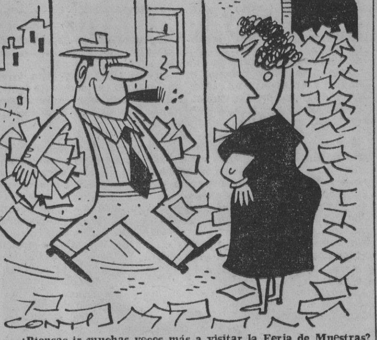
—¿Piensas ir muchas veces más a visitar la Feria de Muestras?