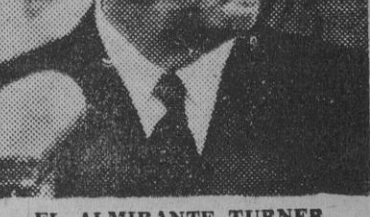
EL ALMIRANTE TURNER

WASHINGTON, 7. — El almirante Charles Turner Joy, ha fallecido en el Hospital Naval de San Diego (California), a consecuencia de una leucemia que venía padeciendo desde hace tiempo. Aun cuando su vida de marino es muy dilatada, el almirante Turner Joy se hizo famoso durante los meses de negociaciones agotadoras con los comunistas chinos en Corea. Negoció con los rojos desde el 8 julio de 1951 al 22 de mayo de 1952 fecha en que fue nombrado director de la Academia Naval de Indianapolis. Este fue el último servicio que prestó a la patria, ya que se retiró en 1954. Antes de las conversaciones de paz en Corea, mandó las fuerzas navales americanas en Extremo Oriente y dirigió los bombardeos contra tropas comunistas de Corea del Norte. Durante la segunda guerra mundial prestó servicios en la flota del Pacífico.—Efe.