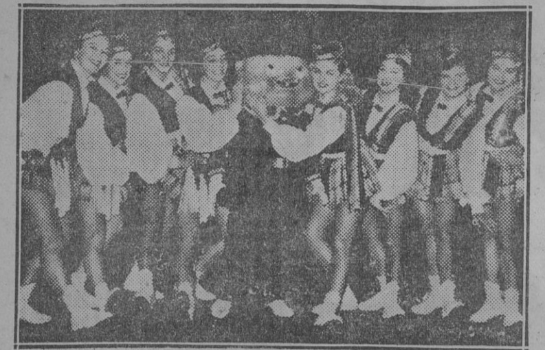
Una de las muchas y fascinantes escenas de la extraordinaria revista sobre hielo «Segun sus deseos», que con tanto éxito se representa todas las noches, en el Palacio Municipal de los Deportes