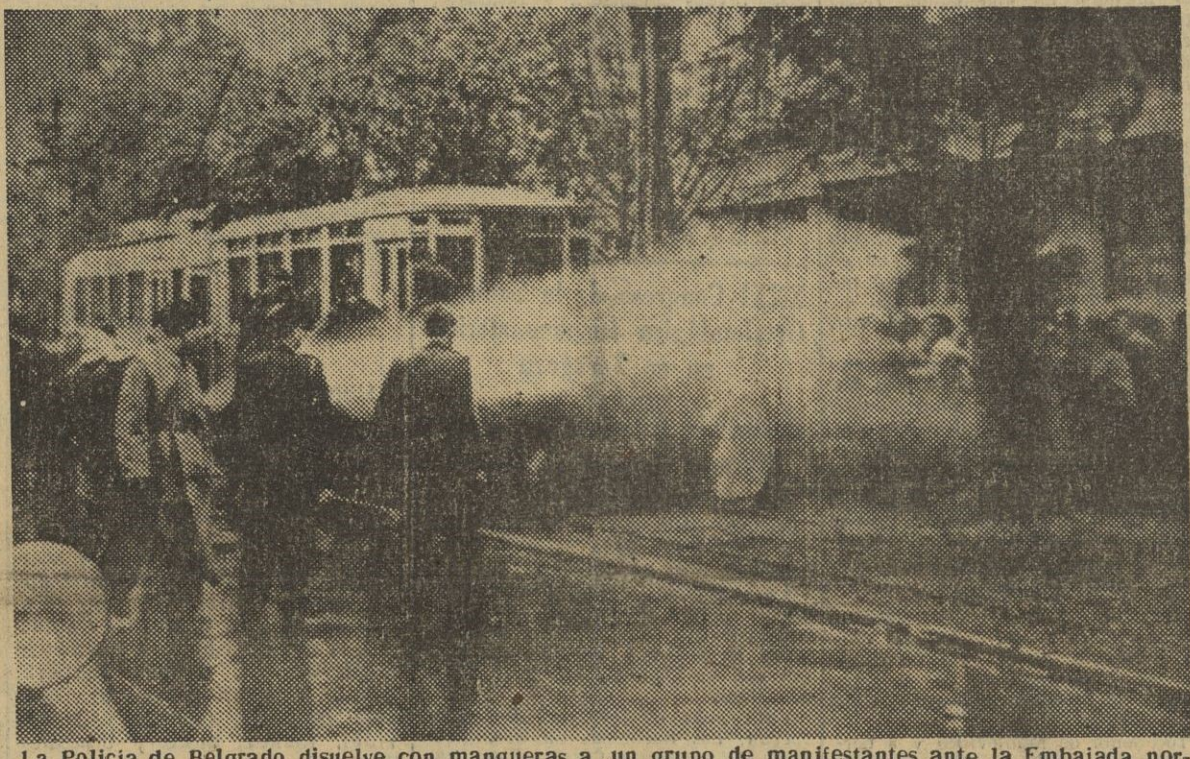
La Policía de Belgrado disuelve con mangueras a un grupo de manifestantes ante la Embajada norteamericana en Belgrado, durante las demostraciones que se hicieron a causa de la propuesta anglo-norteamericana de ceder la zona "A" de Trieste a Italia.

SEDE DE LA O.N.U., 14. — El Consejo de Seguridad de las Naciones Unidas se reunirá mañana para tratar de la disputa de Trieste.