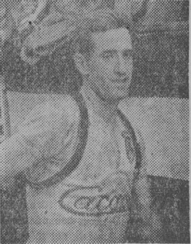
Serra, de «Cacaolat», vencedor en Agramunt