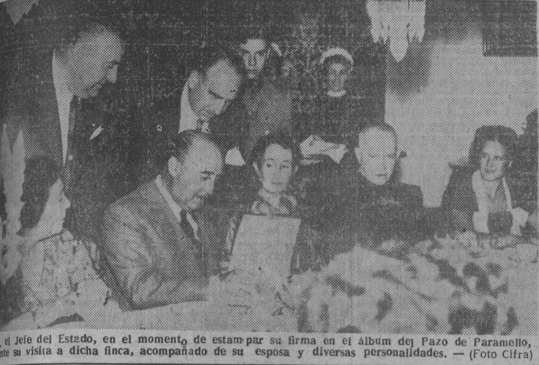
El jefe del Estado, en el momento de estampar su firma en el álbum del Pazo de Paramello, ante su visita a dicha finca, acompañado de su esposa y diversas personalidades.