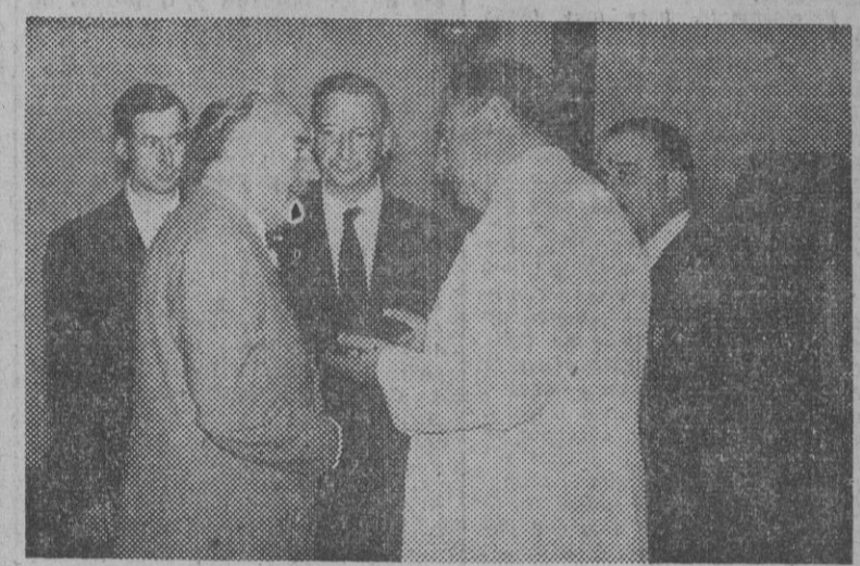
El primer ministro de Irlanda, De Valera, y el ministro de Asuntos Exteriores de España, don Alberto Martín Artajo, durante la entrevista que sostuvieron ambas personalidades en compañía del embajador de dicho país y otras personalidades. Se examinaron algunos aspectos de las relaciones que unen a España e Irlanda, a la luz de los ideales comunes que mueven a ambas naciones.