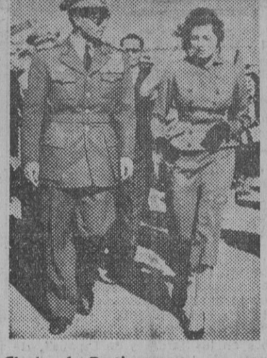
El sha de Persia, con su esposa, la reina Soraya, a la llegada de ésta a Teherán, procedente de Roma, a donde se dirigiera con su esposo al producirse los acontecimientos que terminaron con la vuelta del soberano, persa a su trono.