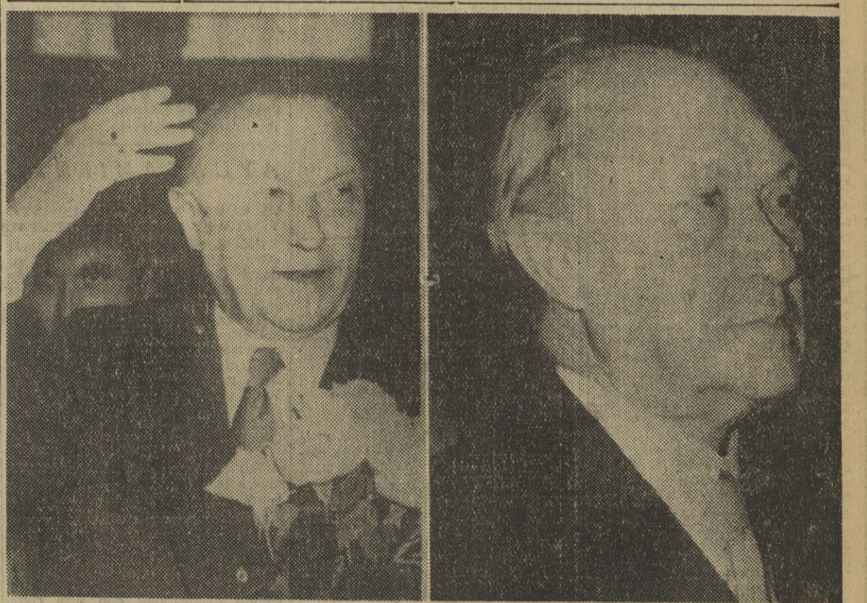
El canciller alemán Konrad Adenauer, que ha obtenido una aplastante mayoría en las elecciones celebradas el domingo en Alemania, aparece en estas dos fotografías después del triunfo. A la izquierda sonríe portando un ramo de flores y con la mano saluda a un numeroso gentío que le aclama; a la derecha aparece con un gesto serio y enérgico, pensando, quizás, en las responsabilidades que trae de la mano ese mismo triunfo obtenido.

Estudiarán la amenaza comunista en el Pacífico y los planes defensivos estratégicos