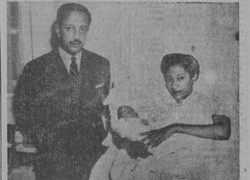
El príncipe heredero de Abisinia y su esposa, la princesa Medfarish, con su primer hijo, varón, nacido el día 16 en Addis Abeba. Hasta ahora, eran padres de tres hijas.

TRASLADO DE LOS RESTOS MORTALES DE BENITO MUSSOLINI