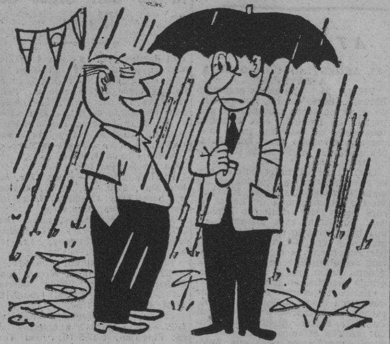
— Podemos decirlo con satisfacción: Nuestra Fiesta Mayor produce las mejores lluvias de la temporada.