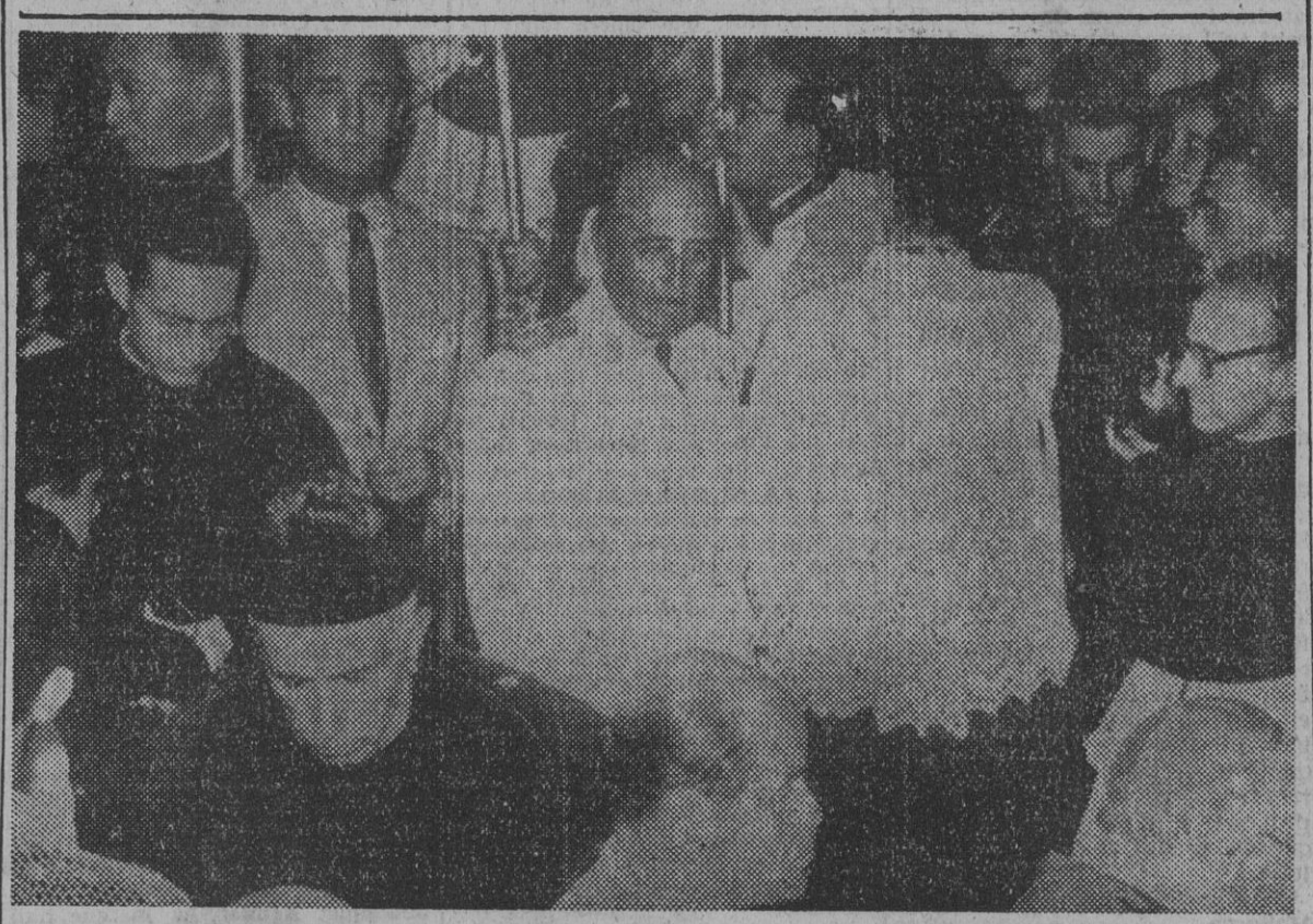
El Caudillo entra, bajo palio, en la nueva catedral de Santander, para presidir la solemne inauguración del templo, que quedó destruido por el deva stador incendio que asoló la capital de la Montaña, en 1941, y fué reedificado por Re giones Devastadas.

El Caudillo inaugura la nueva Catedral de Santander