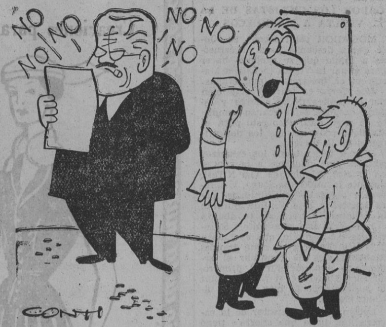
— El camarada Molotov está ensayando por si los occidentales aceptan esa Conferencia que les ha propuesto.