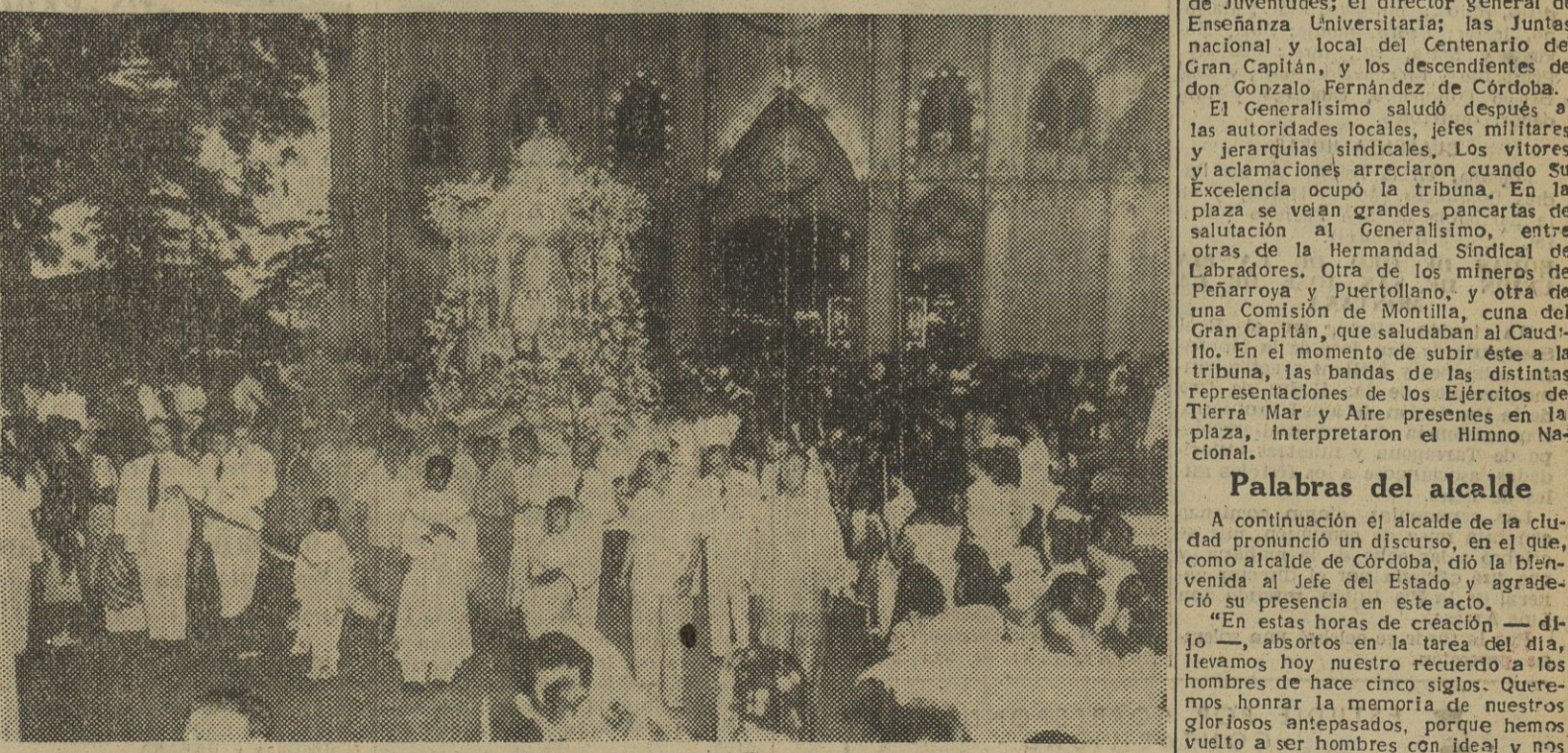
Una inmensa muchedumbre tomó parte en el traslado procesional de la imagen de la Virgen del Pilar desde la iglesia de San Sebastián, en Manila, hasta la Catedral de aquella ciudad, donde quedará definitivamente instalada. La imagen ha sido donada por el Cabildo zaragozano y fue entregada por el ministro español de Asuntos Exteriores, señor Martín Artajo, durante su reciente visita a la capital filipina.