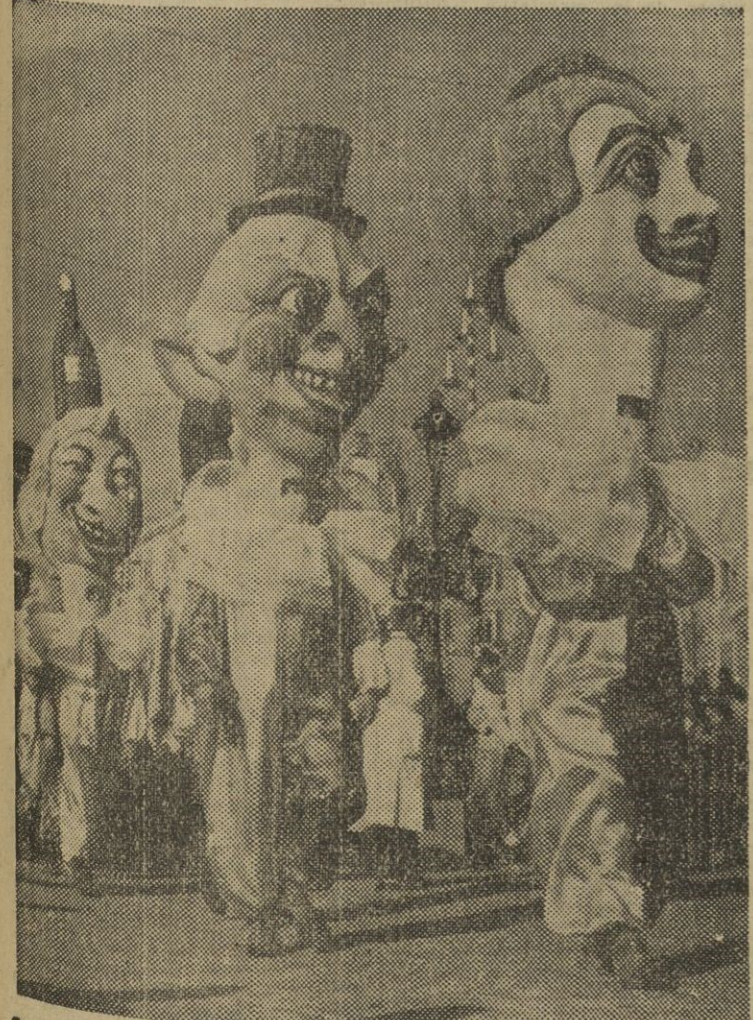
EL CARNAVAL EN NIZA. — Una vista de uno de los desfiles celebrados en Niza con motivo del Carnaval, que ha tenido lugar con la misma alegría que en años anteriores.

STUTTGART. — Los pescadores de langosta de Heligoland (Alemania) están llenos de preocupaciones. La concurrencia de la langosta importada, los gastos elevados de la pesca y los impuestos afectan su negocio de tal manera que han determinado solicitar de un modo original las langostas por ellas pescadas, al objeto de designarlas como producto nacional. Así, pues, encargaron a una fábrica de producción química preparar, para la Asociación de Pescadores de Heligoland, un color especial, atóxico, resistente a la cocción, mediante el cual las langostas del mar del Norte recibirán un adelanto sobre su comparación, un tatuaje, que indicará llamativa e inimitablemente el lugar de su captura. Los pescadores esperan que aumentará esta propaganda original, ya que notablemente su cifra de ventas.