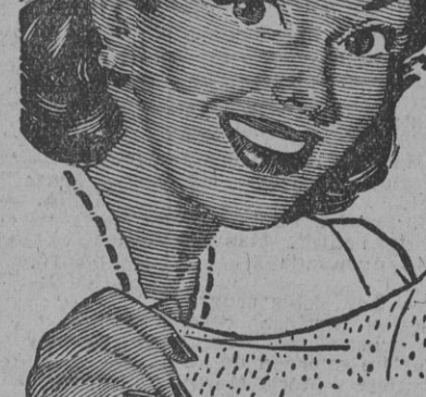
La prefiere la SASTRESA...

Alrededor de las ocho de la tarde de ayer llegó a nuestra ciudad el gran duque Vladimir de Rusia,