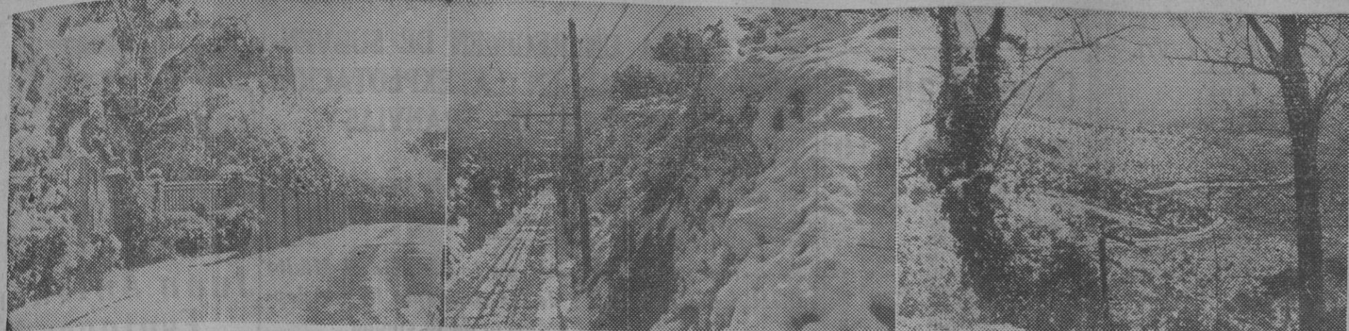
Barcelona sufrió ayer tarde los efectos de una granizada blanca, que, prolongándose hasta las primeras horas de la madrugada de hoy, llegó a cubrir con un leve manto las calles de la ciudad y los alrededores montañosos.