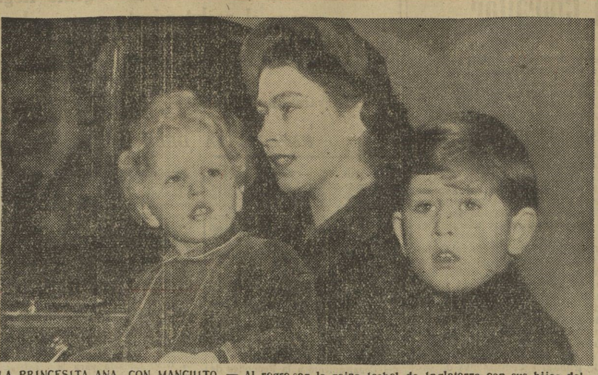
LA PRINCESITA ANA, CON MANGUITO. — Al regresar la reina Isabel de Inglaterra con sus hijos del castillo de Sandringham (Norfolk), la princesita Ana lleva, con gracia de mujercita mayor, pese a sus dos años escasos, un manguito contra el frío