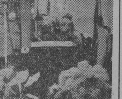
Plan de ayuda a las zonas áridas del sudeste español.

Entrega de títulos en la Escuela de Paracaidistas.