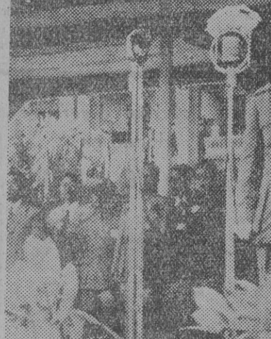
El generalísimo Chiang Kai Chek, en una de sus más recientes salidas ante el público, en Formosa. En dicha ocasión habló el presidente nacionalista chino para pedir al mundo libre que apoye la decisión de Eisenhower referente a la desnuclearización de Formosa

EN BARCELONA. — Pasa por nuestra ciudad el encargado de Negocios del Pakistán en España, que en unas declaraciones a los periodistas hizo constar que "el Pakistán tiene gran simpatía por España y admira