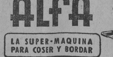
LA SUPER-MAQUINA PARA COSER Y BORDAR

Es lógico. Porque no hay ninguna como ALFA. Es segura, rápida, resistente y económica. Y realiza las labores más complicadas en el mínimo de tiempo. Véala hoy mismo.