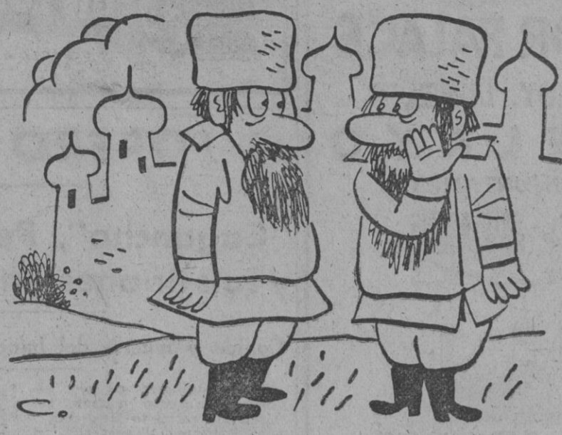
...y después de llamar a Kennan «persona no grata», le han dicho que se marche de Rusia. — ¡Atíza! ¿Y eso es un castigo?