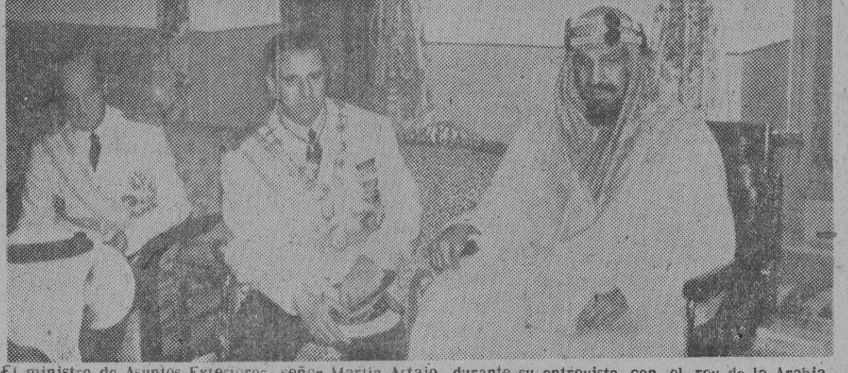
El ministro de Asuntos Exteriores, señor Martín Artajo, durante su entrevista con el rey de la Arabia Saudí, Iben Saud, durante el reciente viaje de una Misión española a Oriente Medio.

DESDE el "Día del Caudillo" de 1951 hasta el que hoy celebra España entra, con la misma fe e idéntico entusiasmo, proyectados hacia la persona que guía los destinos de nuestra Patria, en la que convergen las aspiraciones, cada día más firmes, de los españoles, la proyección de esos mismos destinos fuera de nuestras fronteras ha tenido, en el transcurso de doce meses, un significado y un alcance ecuménico de in-