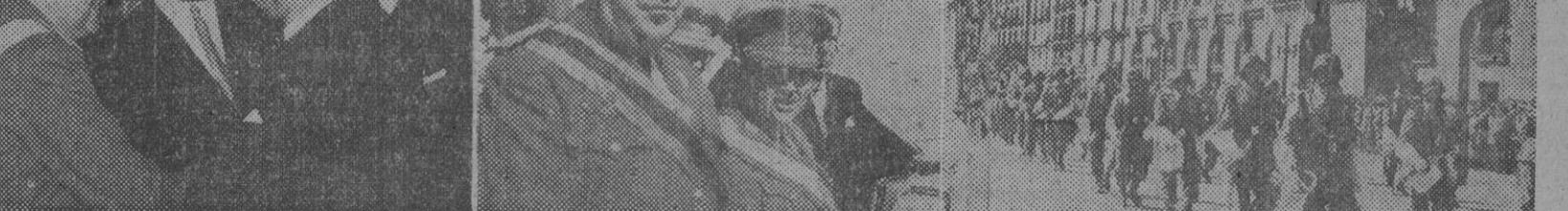
Con motivo de la recepción celebrada esta mañana en el Palacio de Capitanía General, nuestro redactor gráfico, Pérez de Rozas, ha captado las precedentes instantáneas que recogen varios momentos de la solemne ceremonia. Una vez más, Barcelona ha puesto de manifiesto su absoluta y total adhesión al Caudillo, así como ha renovado su admirativa simpatía por el Ejército, que bajo tan heroica y sabia capitania la reincorporó a una España unida, fuerte y segura de su destino histórico.

El alcalde, señor Simarro, al pasar frente al capitán general, se adelantó unos metros, y pronunciando unas palabras, en las que dijo: "MI general. La ciudad de Barcelona y el Ayuntamiento reiteran sus sentimientos de inquebrantable adhesión al Caudillo de España, cuyo día hoy se celebra".