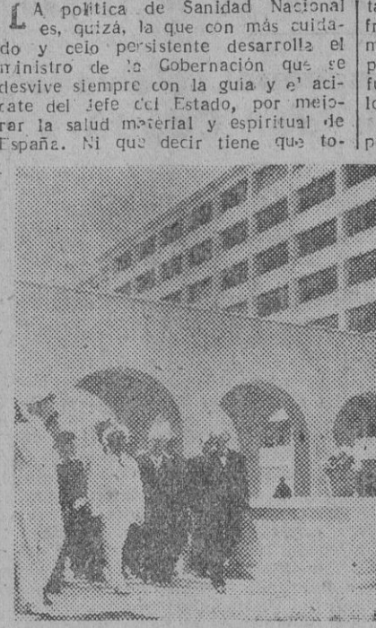
S. E. el Jefe del Estado durante la inauguración de la Ciudad Sanatorial de Tarrasa.

Datos de la lucha antituberculosa, contra la lepra y la mortalidad infantil