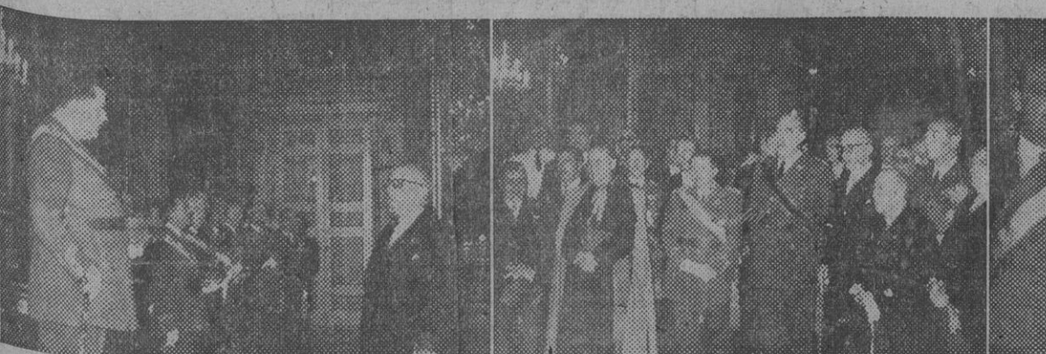
Con motivo de la recepción celebrada esta mañana en el Palacio de Capitanía General, nuestro redactor gráfico, Pérez de Rozas, ha captado las precedentes instantáneas que recogen varios momentos de la solemne ceremonia. Una vez más, Barcelona ha puesto de manifiesto su absoluta y total adhesión al Caudillo, así como ha renovado su admirativa simpatía por el Ejército, que bajo tan heroica y sabia capitania la reincorporó a una España unida, fuerte y segura de su destino histórico.

(DISCURSO DEL GENERALISIMO FRANCO AL POSESIONARSE DE LA JEFATURA DEL ESTADO)