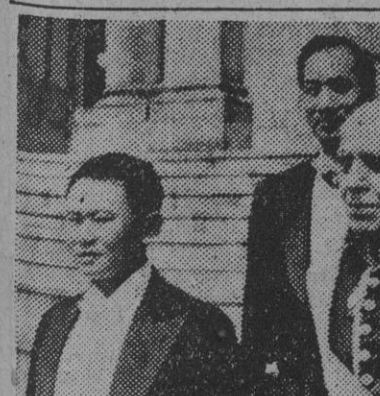
El embajador de España en la China Nacional, don Antonio Gullón, a la salida del palacio presidencial, de Formosa, donde presentó sus cartas credenciales al presidente Chian Kai Shek.

Embajador de España en la China Nacional