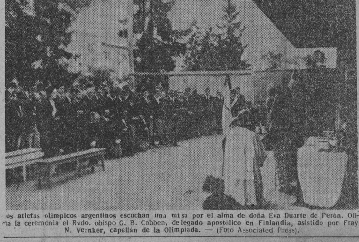
Los atletas olímpicos argentinos escuchan una misa por el alma de doña Eva Duarte de Perón...

El Wafd rechaza la propuesta aliada de defensa del cercano Oriente