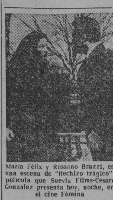
Maria Félix y Rossano Brazzi, en una escena de "Hechizo trágico", película que Suevia Films-Cesare González presenta hoy, noche, en el cine Fémima