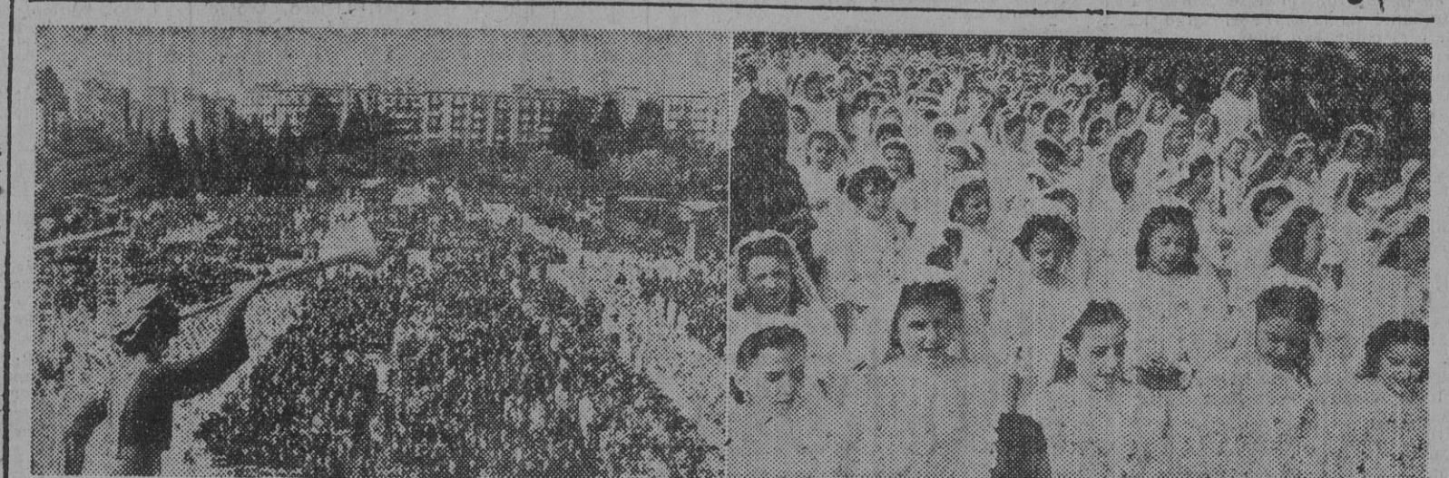
Dos aspectos del impresionante y emotivo acto celebrado esta mañana en la Plaza de la Sagrada Familia, durante el cual han recibido por primera vez la Sagrada Eucaristía, más de 10.000 niños y niñas de Barcelona.