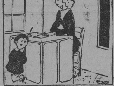
TRIUNFO LA VERDAD

A un famoso abogado le fué encargada la defensa de un célebre delincuente, que se había hecho el amo de una ciudad. Vista la causa, la elocuencia del famoso abogado consiguió la absolución de su cliente, apresurándose a enviar a los amigos de éste el siguiente telegrama: —Ha triunfado la causa de la justicia! Pocas horas después los amigos del gangster le contestaban: —¡Apele inmediatamente!