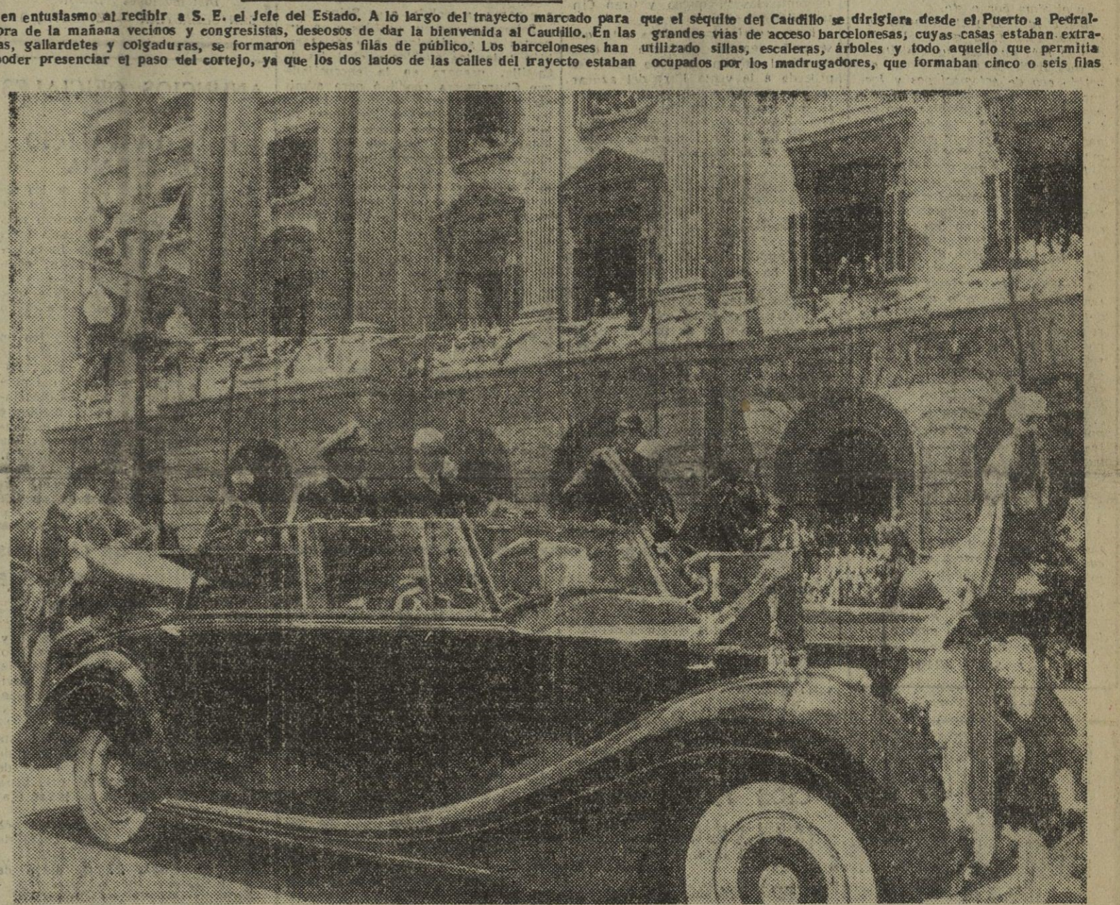
S. E. el Jefe del Estado, Generalísimo Franco, acompañado del alcalde de la ciudad, a su paso por el Paseo de Colón, frente al edificio de Capitanía General, momentos después de su llegada a nuestra ciudad, donde le ha sido tributado un apoteósico recibimiento

También a primera hora fuerzas del Ejército cubrieron la carrera, desde la misma Puerta de la Paz hasta el Palacio de Pedralbes, a través del paseo de Colón, Gran Via Layetana, Ronda de San Pedro, paseo de Gracia y Avenida del Generalísimo.