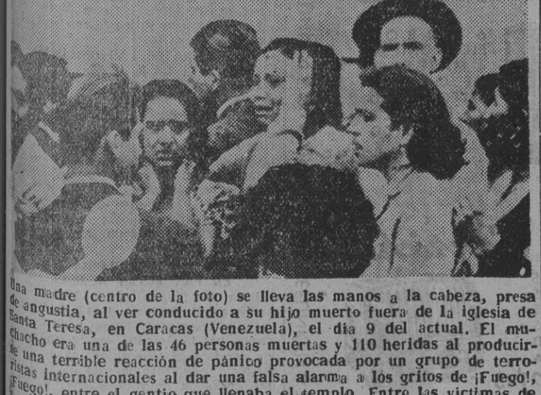
Una madre (centro de la foto) se lleva las manos a la cabeza, presa de angustia, al ver conducido a su hijo muerto fuera de la iglesia de Santa Teresa, en Caracas (Venezuela), el día 9 del actual. El motu proprio era una de las 46 personas muertas y 110 heridas al producirse una terrible reacción de pánico provocada por un grupo de terroristas internacionales al dar una falsa alarma a los gritos de ¡Fuego!, ¡Fuego!, entre el gentío que llenaba el templo. Entre las víctimas de la criminal fechoría se contaron 21 niños.

CARACAS, 15. — La Policía informa que se procedió a la detención de seis personas, en relación con los sucesos producidos en dos iglesias de Caracas durante la Semana Santa.