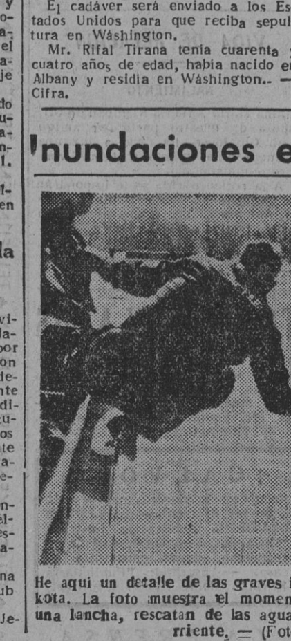
He aquí un detalle de las graves inundaciones ocurridas en North Dakota. La foto muestra el momento en que unos campesinos, desde una lancha, rescatan de las aguas a un perro arrastrado por la corriente.