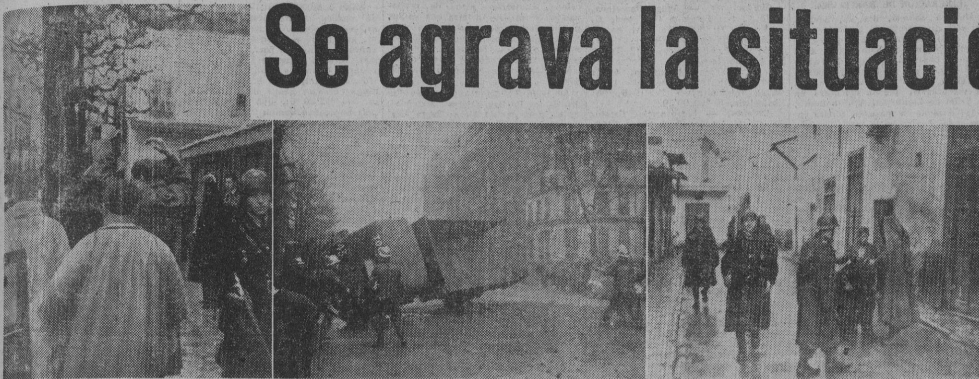
Recogemos en estas fotografías varios aspectos de los desórdenes que están ocurriendo estos días en Túnez. 1. La gendarmería francesa patrulla por las calles de Mateur, chequeando, minuciosamente, a los elementos sospechosos. — 2. Los bomberos vuelven al tránsito a este camión, que, cargado de carbón, fue derrribado por los sediciosos. — 3. En una calle de La Medina, la Policía registra a uno moro por si fuera portador de armas. — (Fotos Keystone)

Las guarniciones francesas reciben orden de estar alerta