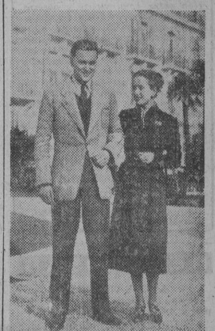
El príncipe Nicolás Romanoff, que contrajo matrimonio el pasado lunes con la señorita Sveva Gherardesca, descendiente de una rica familia italiana, acompaña a su novia durante un paseo matinal

TÚNEZ, 25. — Unos trescientos nacionalistas tunecinos han cambiado disparos con la Policía en el barrio árabe de la ciudad llamado Debbab el Kadra. No se conoce el número de víctimas. — Efe.