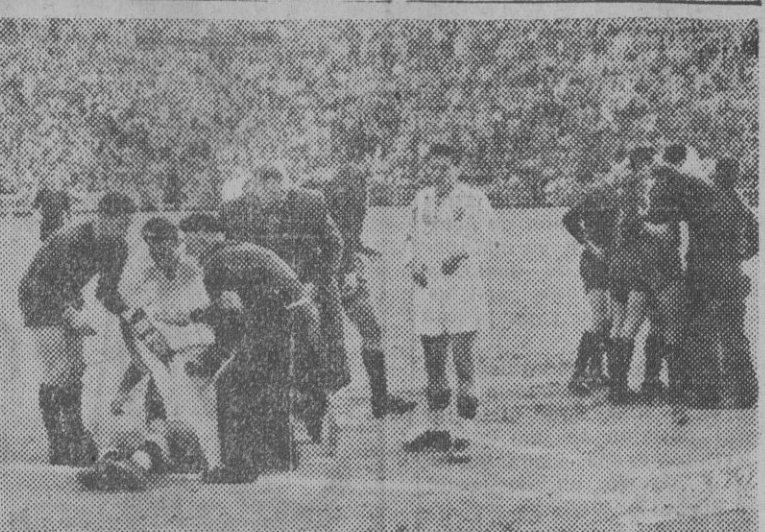
Momentos después de producirse el choque entre el delantero Cairo y Biosca, que resultaron con una herida en la cabeza ambos jugadores.

ambos conjuntos fué el sistema defensivo, especialmente el del Sevilla, poco menos que inabordable por su dureza.