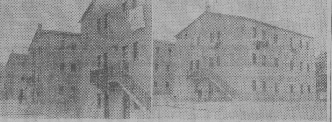
He aquí algunos de los bloques de viviendas ultrabaratatas que han sido construidas en Montjuich...