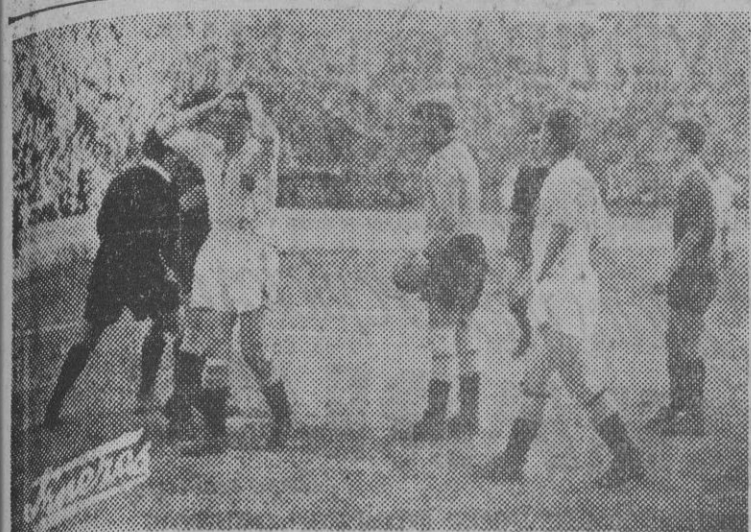
Penalty contra el Valencia. Los jugadores blancos expresan su disgusto, mientras López lleva el balón en el lugar del castigo.