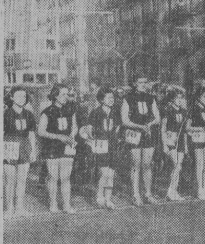
Momento de ser dada la salida a la participación femenina del Gran Premio Jean Bouin.