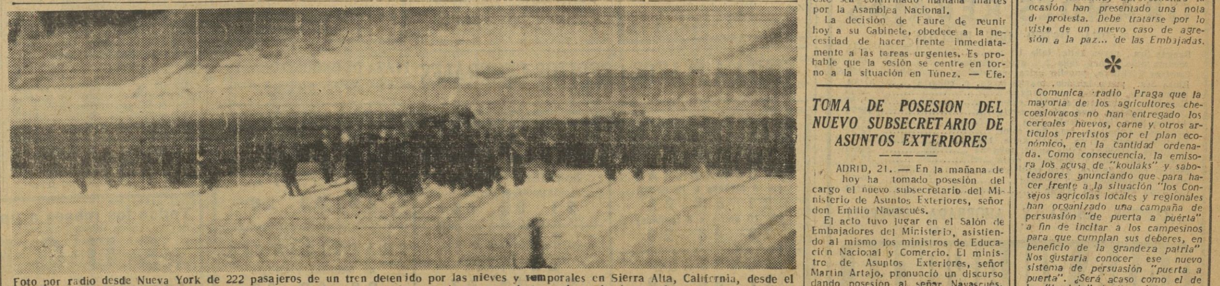
Foto por radio desde Nueva York de 222 pasajeros de un tren detenido por las nieves y temporales en Sierra Alta, California, desde el día 13 del actual y que ha recibido ayuda para evitar la muerte de los pasajeros, que al llegar los salvadore: solo tenían comida para veinticuatro horas.