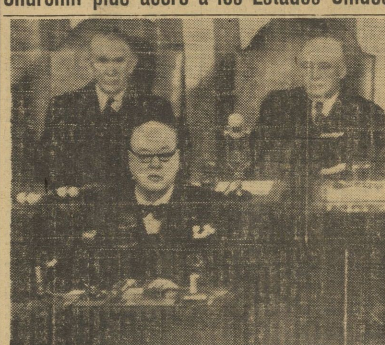
Churchill, en el Congreso de Washington, al pedir acero y no dinero a los EE. UU. Detrás el vicepresidente Barkley y el presidente del Congreso, Sam Rayburn.

Churchill pide acero a los Estados Unidos