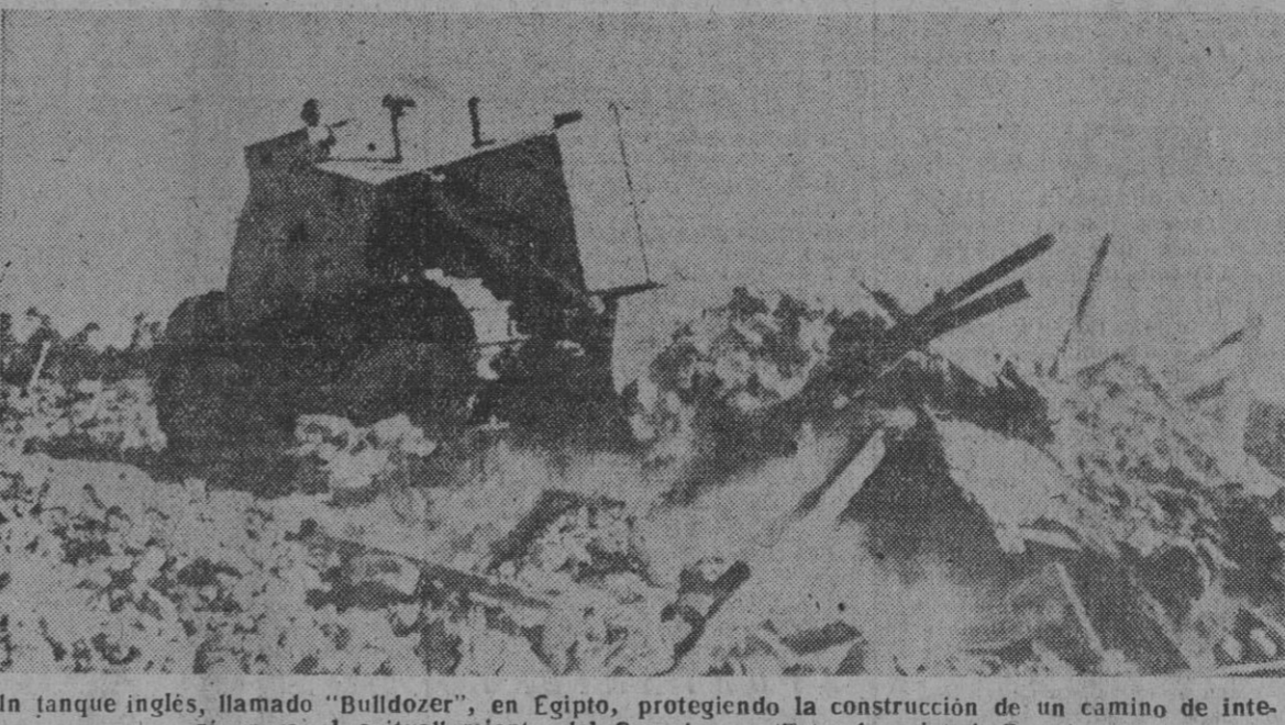
Un tanque inglés, llamado "Bulldozer", en Egipto, protegiendo la construcción de un camino de interés para el avituallamiento del Canal.