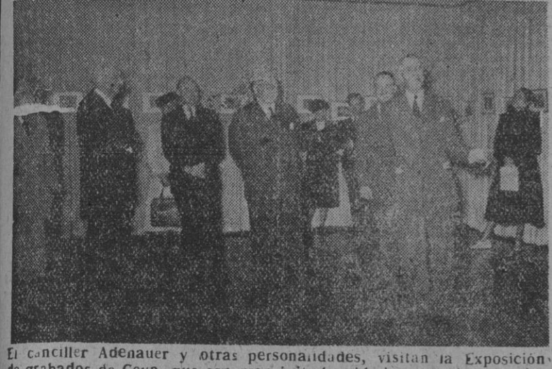
El canceller Adenauer y otras personalidades, visitan la Exposición de grabados de Goya, que con gran éxito ha sido inaugurada en Berlín