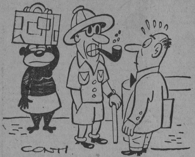
—Yo recibir informe de últimas temperaturas! ¡Por eso venir así!