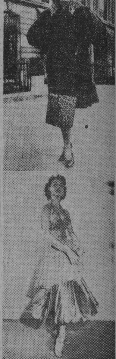
1. A la colección del costurero parisense Jacques Heim pertenece este conjunto compuesto de vestido y chaquetón confeccionado en lana roja. Ya adornado con piel de leopardo. — 2. Kirchmín es el nombre de este vestido de noche en satín oro y naranja del modisto parisense Schiaparelli.