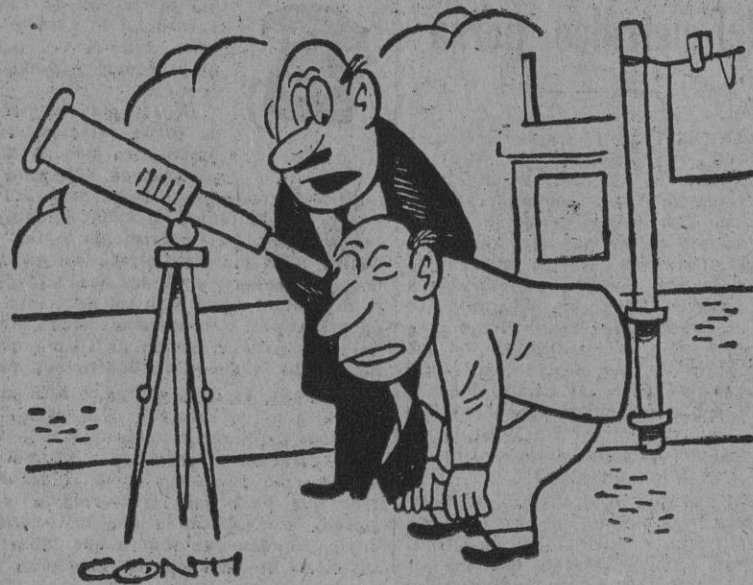
CONTI —¿Ve usted algo? —No veo nada. —¡Pues eso es precisamente el eclipse, hombre!