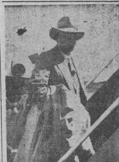
Tshekedi Khawa, ex regente de la tribu Bamangwato, en las escaleras del avión que desde Londres le llevará a Bechuanaland, donde le esperará la decisión de los Tribunales que dirimirán si vuelve o no a regentar el país

HA FALLECIDO EL BARON ERNST VON WEISSAECKER