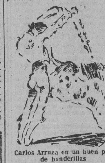
Carlos Arruza en un buen par de banderillas