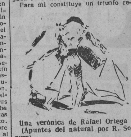
Una verónica de Rafael Ortega (Apuntes del natural por R. Saura)