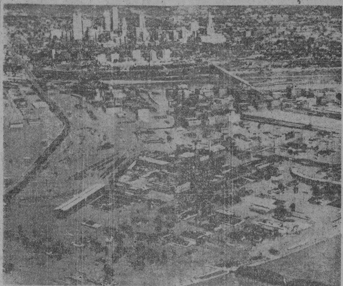
Foto aérea de Kansas City en la que se ve el área de inundaciones producidas por el río Missouri