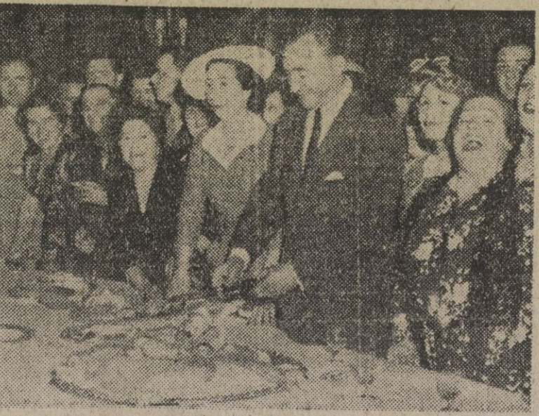
Los embajadores de España en Londres, duques de Primo de Rivera, rodeados de españoles durante la recepción que ofrecieron a la colonia, en Londres, el día 18 de Julio.