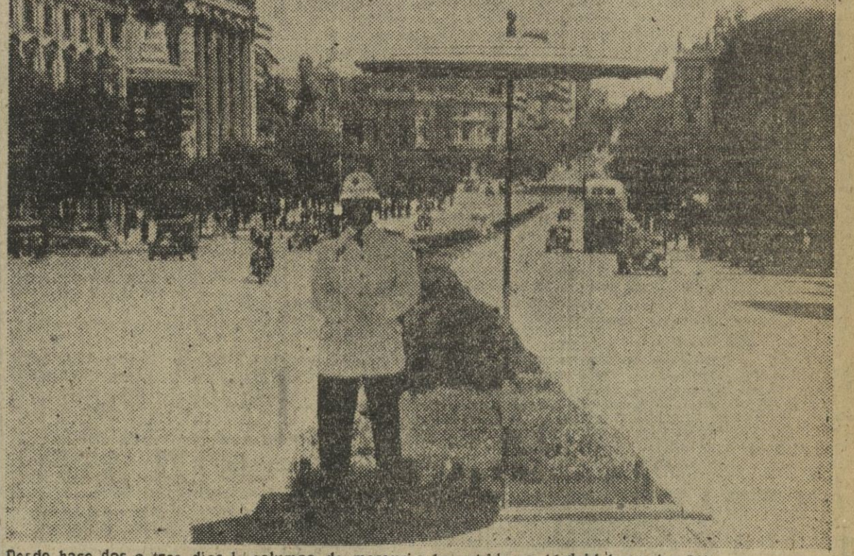
Desde hace dos o tres días la columna de mercurio ha subido en Madrid hasta los 36° y el que más y el que menos busca la sombra, como este guardia del tráfico debajo de esa diana a manera de quitasol. En las principales vías de la capital madrileña han sido instalados varios quitasoles para guardias.