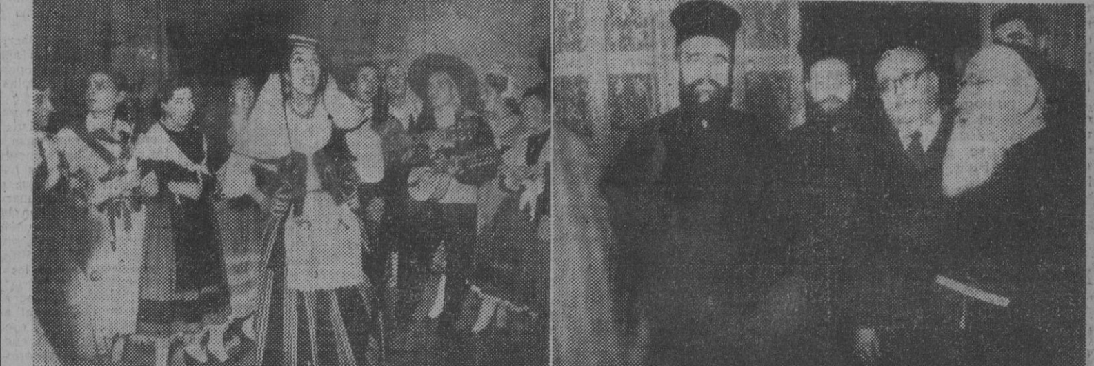
La información gráfica recoge dos momentos del triunfal viaje que está realizando los «Coros y Danzas» de España por algunos países europeos y del Medio Oriente. 1. Actuación en la Embajada de España en Bruselas. — 2. La representación en nuestra Legación de Amman.