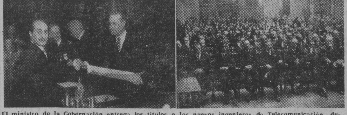
El ministro de la Gobernación entrega los títulos a los nuevos ingenieros de Telecomunicación, durante un acto celebrado en la sala de actos del Palacio de Comunicaciones. En la siguiente fotografía, aspecto de la sala en un momento del acto.