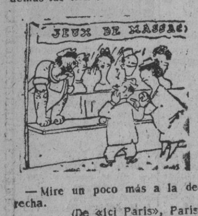
— Mire un poco más a la derecha. (De «ici Paris», Paris)

Psiquiatra. — Individuo que no tiene preocupaciones cuando los demás las tiene.