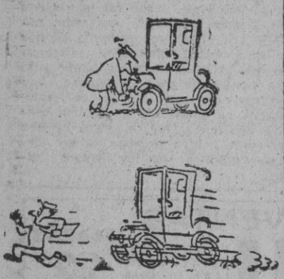
EL VIEJO AUTOMOVIL (Del «Saturday E. Post», N. Y.)

Holland expresó también su opinión de que existe relación entre la creación de dicho pacto y el rearme japonés. Agregó que se deben dar medios a los japoneses para que se defiendan, pero no para que puedan atacar. — Efe.