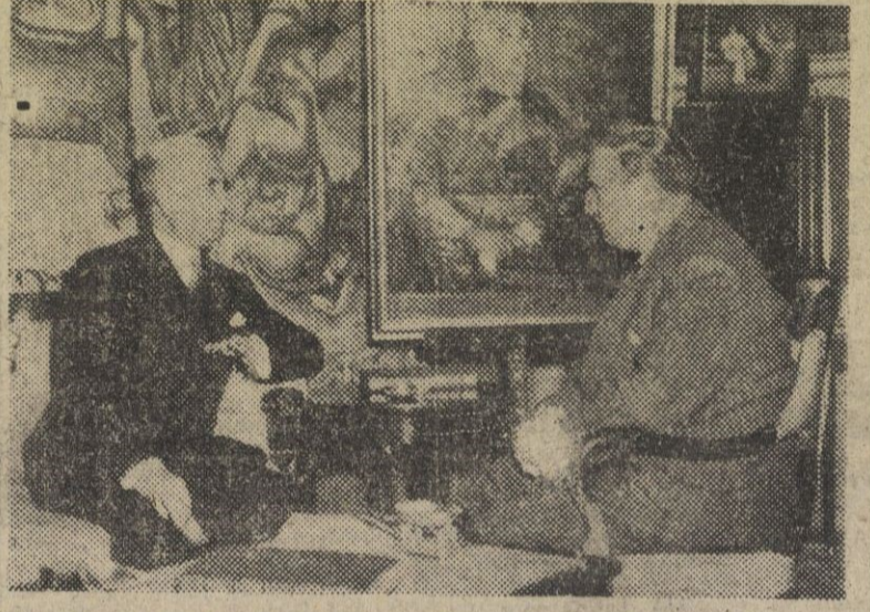
El ministro de Afganistán, Omar Khan, durante la presentación de copias de las Cartas de Estilo, a nuestro ministro de Asuntos Exteriores, señor Martín Artajo, en el palacio de Santa Cruz.