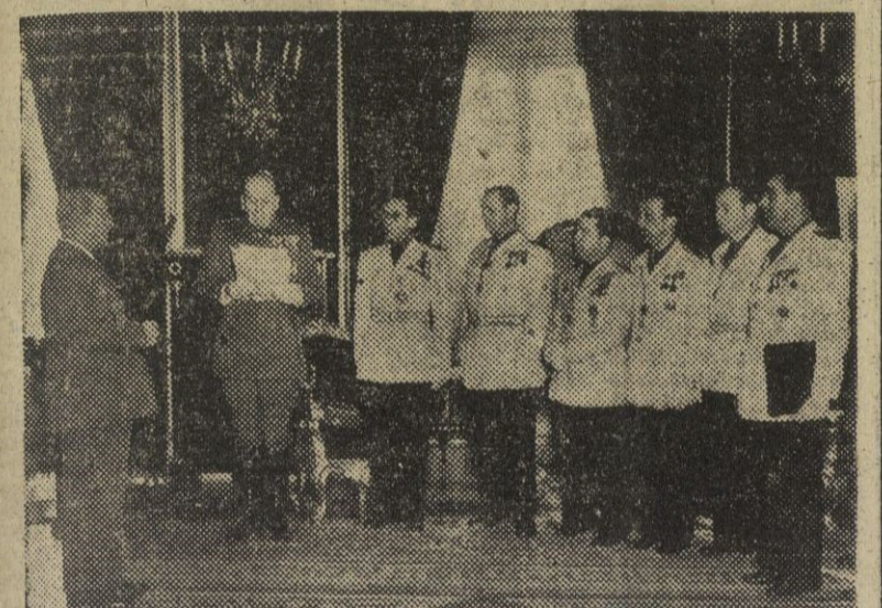
Los miembros del Ayuntamiento de Valladolid, presididos por su alcalde y acompañados por el gobernador civil, cumplimentaron a S. E. el Jefe del Estado para hacerle entrega de la Primera Medalla de la Ciudad.