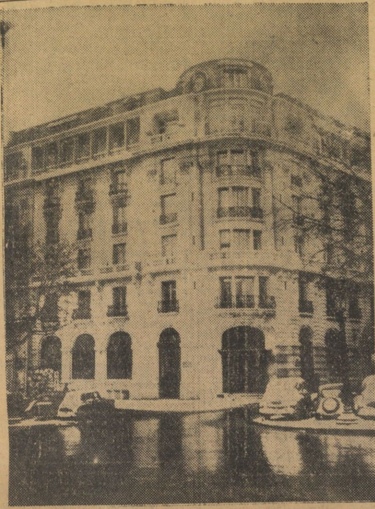
Una vista exterior del Hotel Astoria, de París, posible cuartel general de Eisenhower, como jefe supremo de las fuerzas del Pacto Atlántico.

El posible cuartel general de Eisenhower