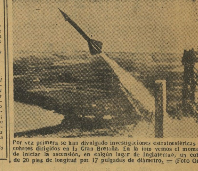
Por vez primera se han divulgado investigaciones estratosféricas con cohetes dirigidos en la Gran Bretaña. En la foto vemos el momento de iniciar la ascensión, en algún lugar de Inglaterra, un cohete de 20 pies de longitud por 17 pulgadas de diámetro.