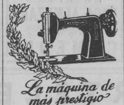
La máquina de más prestigio