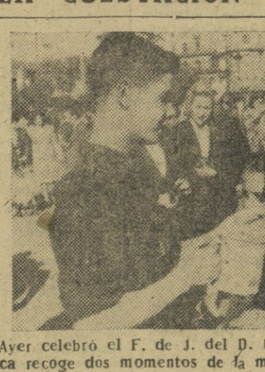
Ayer celebró el F. de J. del D. U. la cuestación anual pro Obras Asistenciales. La información gráfica recoge dos momentos de la misma, que se efectuó con gran éxito.