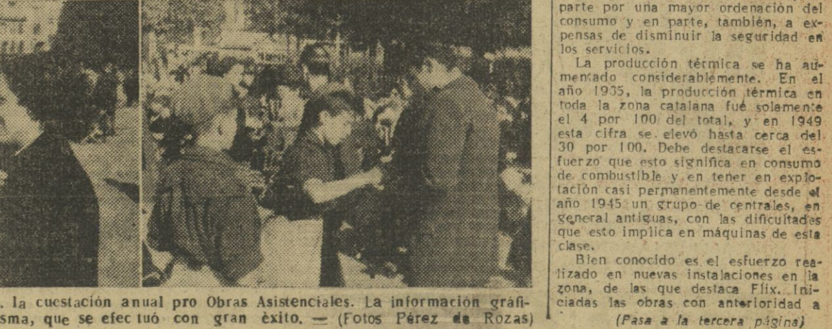
Ayer celebró el F. de J. del D. U. la cuestación anual pro Obras Asistenciales. La información gráfica recoge dos momentos de la misma, que se efectuó con gran éxito.