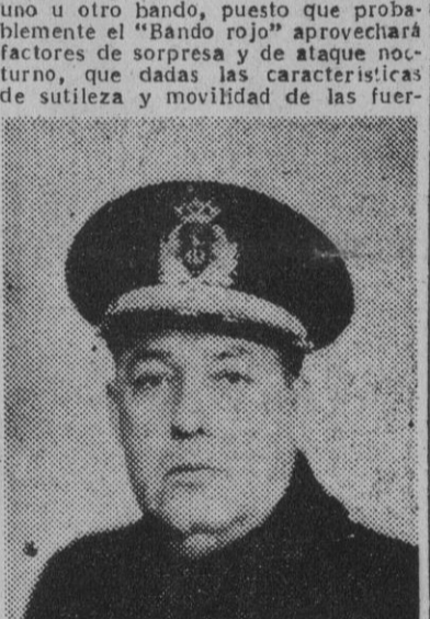
Contraalmirante don Felipe de Abarzuza y Oliva, almirante jefe del convoy del bando azul de las maniobras