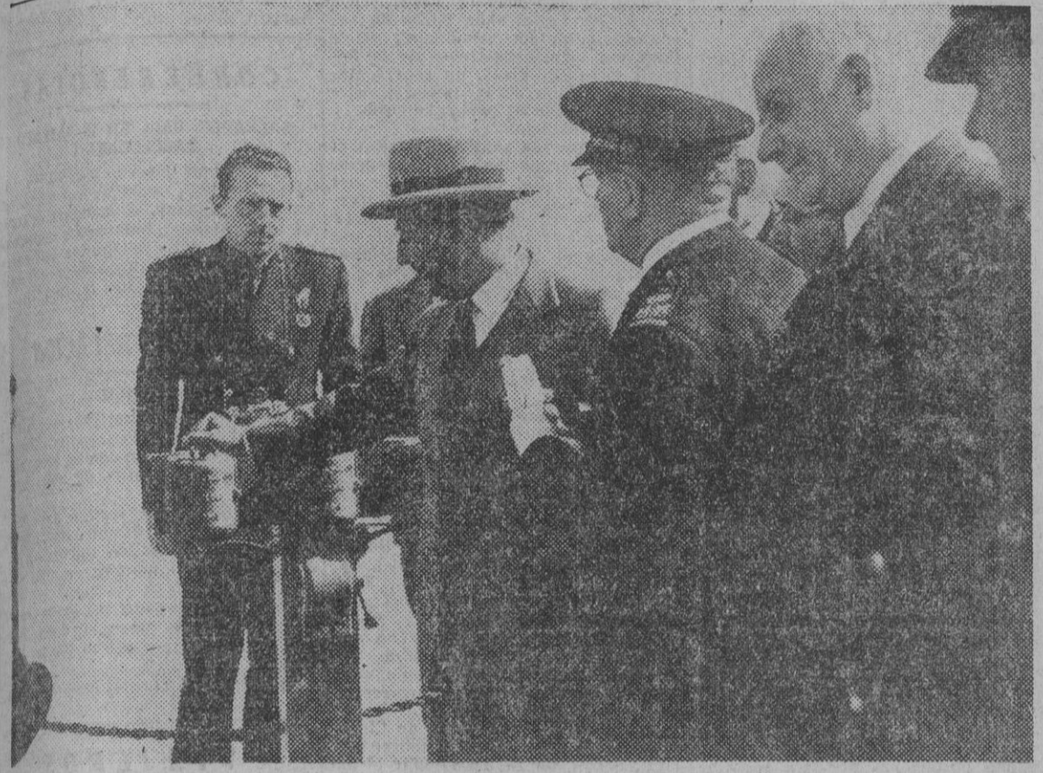
S. E. el jefe del Estado acciona los mandos eléctricos para abrir las compuertas de la presa de derivación del Canal Viejo del Alberche, por él inaugurada.

El Caudillo inaugura una presa en el canal viejo del Alberche