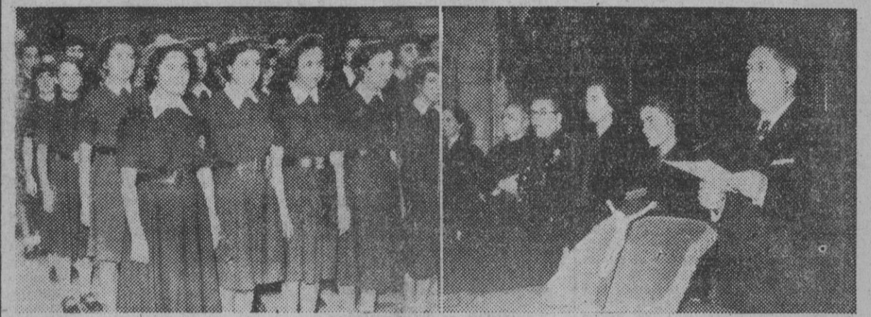
La Sección Femenina celebró ayer, con diversos actos, la festividad de Santa Teresa de Jesús, su Patrona. La información gráfica recoge dos momentos de la ceremonia del paso de Flechas a la Sección Femenina, celebrado ayer en el Salón de Ciento del Ayuntamiento, bajo la presidencia del gobernador civil.

La Sección Femenina celebra la festividad de Santa Teresa