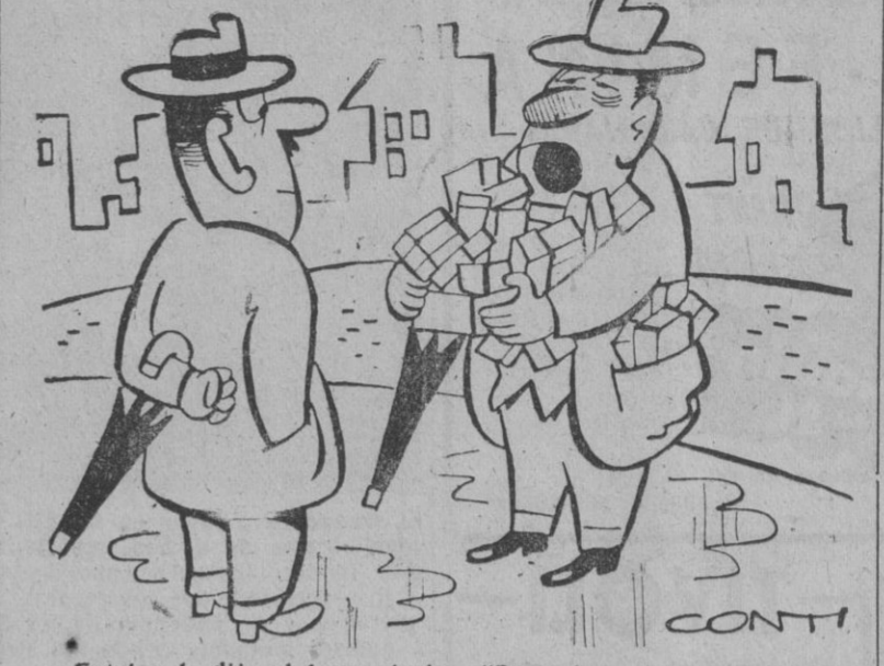
Entré y le dije al farmacéutico: "Deme lo que tenga contra los resfriados".