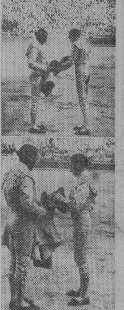
En la plaza de Valencia, los diestros Julio Aparicio y Rafael Baez "Litrí", reciben los trastos de mar de manos del más antiguo matador de toros en activo, "Cagancho", que actuó de padrino en la ceremonia de la alternativa.