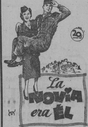
Localidades anticipadas (Autorizada para mayores)