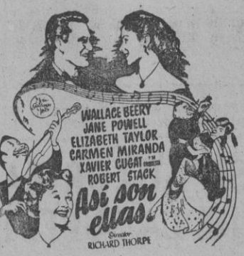
Una fuerte dosis de optimismo y gran alegría (Tolerada para menores)

Las mejores referencias sobre esta encantadora comedia, las da el mismo público