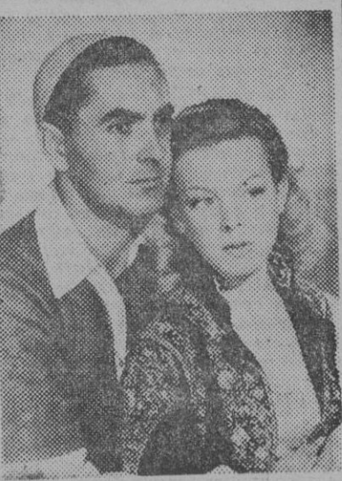
Tyrone Power y Cecilia DeLoe, en "La rosa negra", película H. Fox-film, que esta noche será estrenada en el cine Kursaal

TALIA Vea usted a los mejores cómicos acrobáticos del Mundo LES RENATIS en «SI, SI, MARLENE...» (Varieté internacional) HOY Y MAÑANA, ULTIMOS DIAS