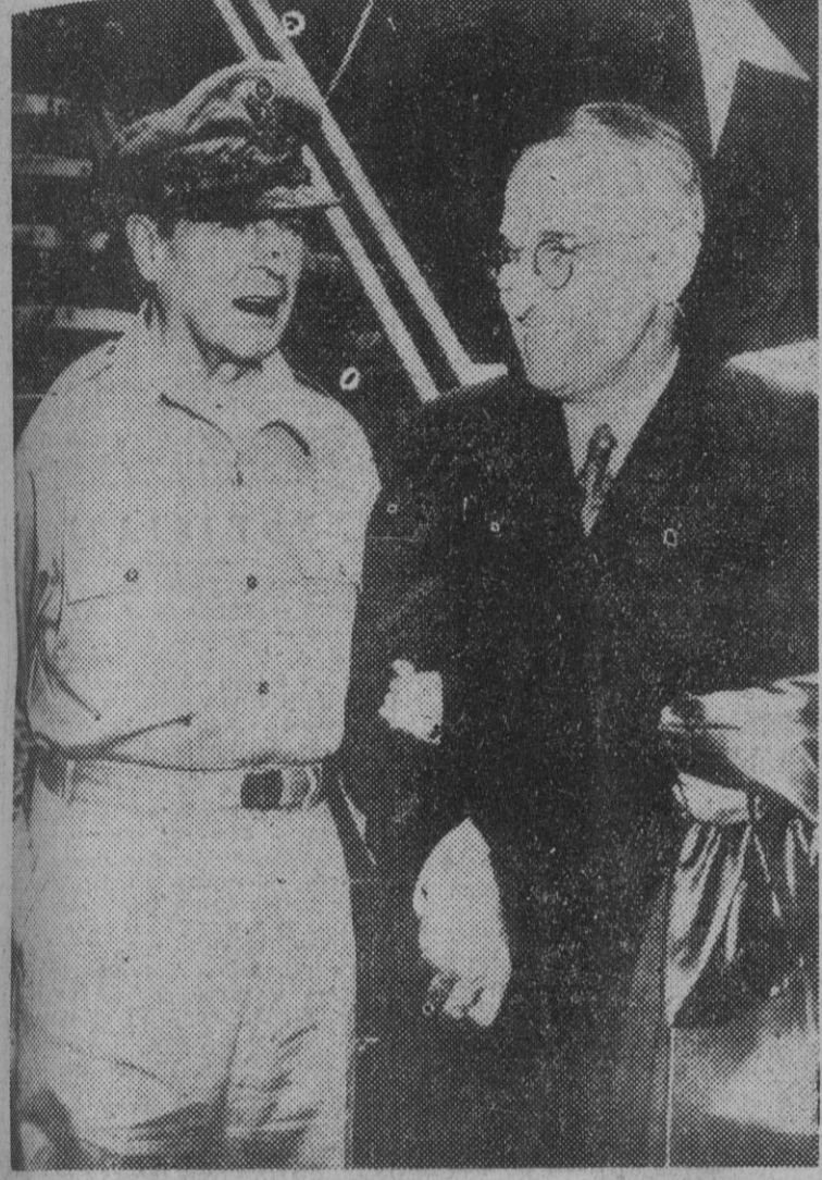
Por primera vez la cámara fotográfica se adelanta a los acontecimientos y funciona a millares de kilómetros, sin teleobjetivo de ninguna clase. Esto sucede cuando el artista de la fotografía compone en su laboratorio la copia que exige los acontecimientos de actualidad. He aquí una composición gráfica de la entrevista Truman-Mac Arthur en la isla de Wake.