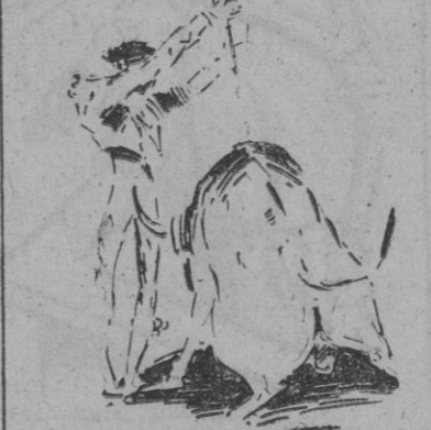
Un par de rehiles de Luis Miguel «Dominguín»