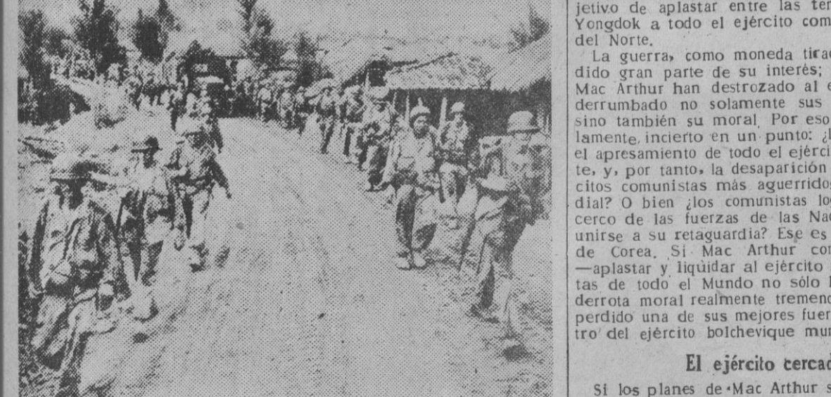
Fuerzas de Infantería norteamericana acompañadas de sus convoyes de aprovisionamiento, avanzan por una carretera de Corea del Sur en dirección al sector de Yongson para reforzar a las unidades que luchan encarnizadamente contra los comunistas.