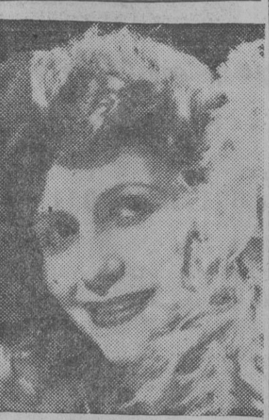
FIGURA DEL TEATRO