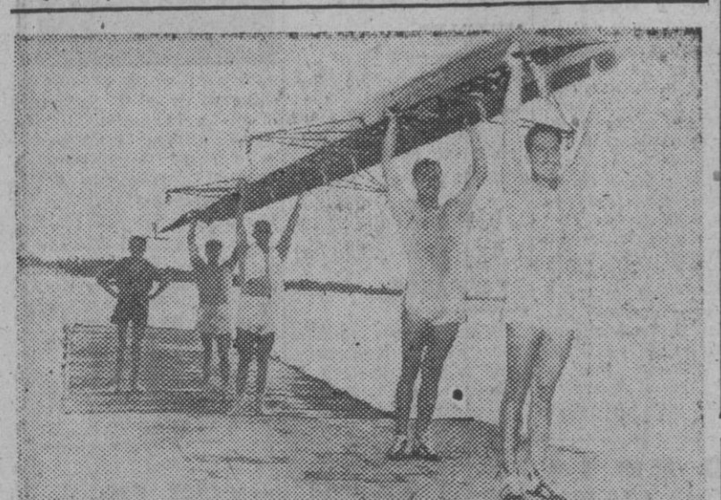
Los cuatro remeros y timonel de la embarcación "Ur-Kirolak", de San Sebastián, que representan a España en el Campeonato de Europa de Remo, que se celebra en Milán.