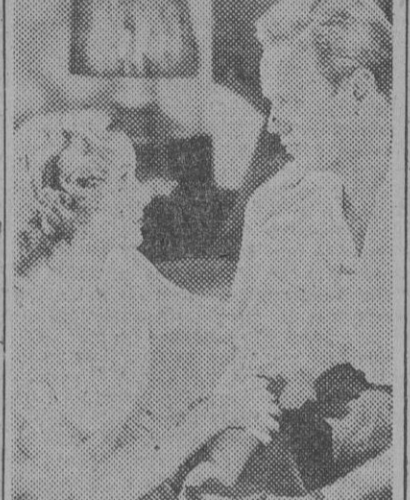
Verónica Lake y Richard Widmark, en una escena de "Furia del trópico", película que inaugura la temporada mañana, jueves, los cines Astoria y Fémia