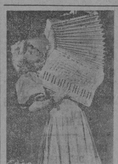
Mignon, la gentilísima artista que triunfa en Remea con "Melodías del manubrio"