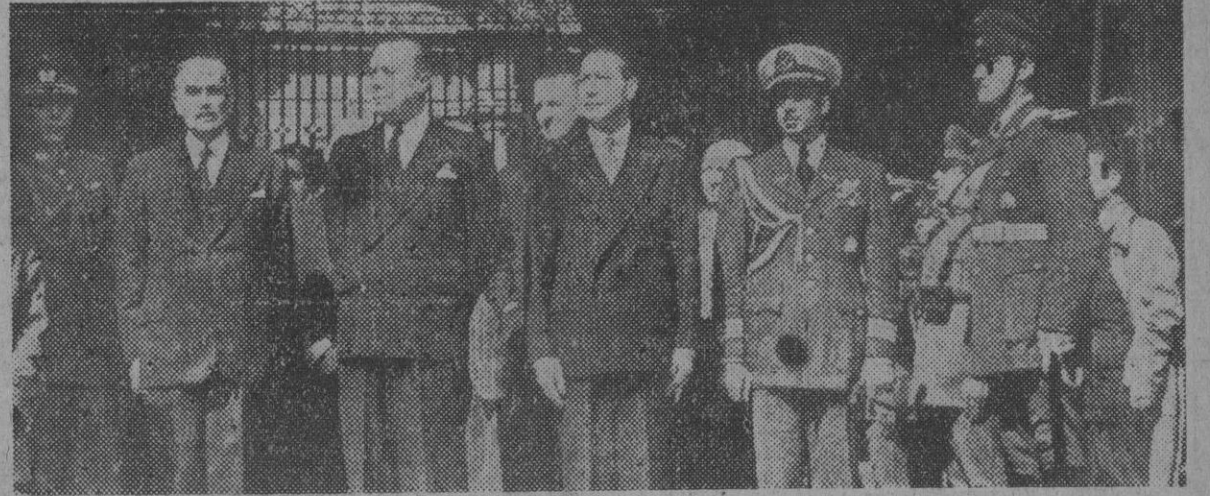
El presidente de la República de Chile, don Gabriel González Videla, con el ministro de Relaciones Exteriores y el de Economía y Comercio, que asistieron al traslado de los restos del presidente del Senado y ex presidente del país, don Arturo Alessandri.