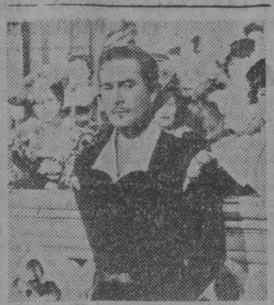
Errol Flynn, en una escena de "El burlador de Castilla", la película en tecnicolor con que el Tivoli inaugurará el lunes la nueva temporada