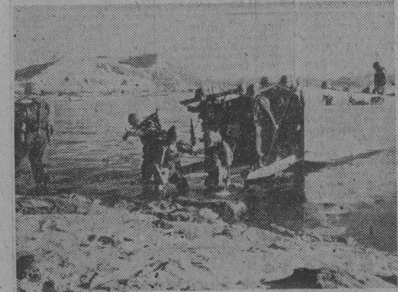
Soldados de Infantería de Marina, efectuando un desembarco en una pequeña isla, frente a Seul.