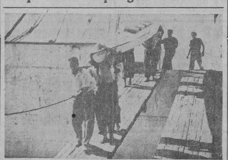
Los estudiantes del S. E. U., que irán en peregrinación a Roma en piraguas, para ganar el jubileo del Año Santo y rendir al Santo Padre el homenaje de todos los estudiantes españoles a su llegada a Palma de Mallorca, desembarcando sus embarcaciones del buque "Ciudad de Ibiza".