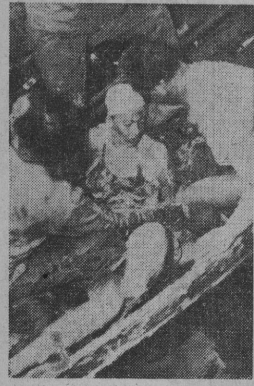
1. Maltrecha y extenuada por el esfuerzo fallido de 13 horas y media, la joven nadadora americana Shirley May France, en el momento de ser subida al falucho que la acompañó, después de su frustrado segundo intento de cruzar el Canal de la Mancha. — 2. Florence Chadwick, la formidable nadadora americana que ha cruzado el Canal en el tiempo record de 13 h. 23 m., sonríe al iniciar el retorno a Francia en barca, después de su triunfo.

Un intento frustrado y una victoria en el Canal de la Mancha