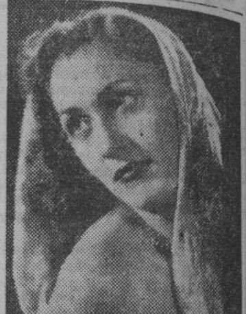
FIGURA DEL TEATRO