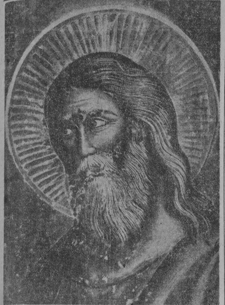
EL APOSTOL SANTIAGO, PATRON DE ESPAÑA, ANTE CUYA VENERANDA IMAGEN COMPOSTELANA SE EFECTUARA MAÑANA LA TRADICIONAL Y SOLEMNE OFRENDA DEL JEFE DEL ESTADO