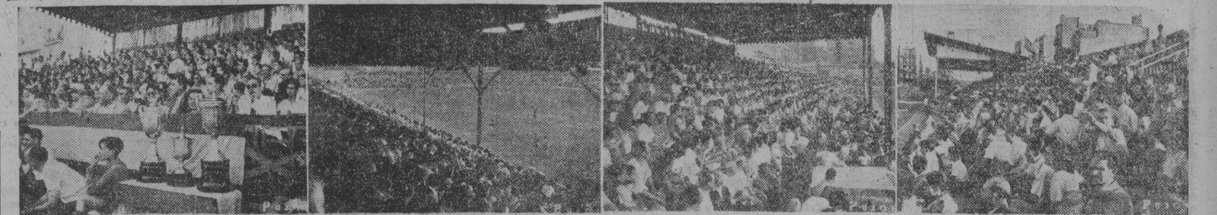
El entusiasmo por ver y admirar a estos pequeños colosos del balón, que ayer disputaron la final de tan apasionante torneo, fué realmente indescribible. El campo del Sans registró el mayor lleno de su historia, como lo prueban estas vistas generales del recinto don de se celebró la esperada y apasionante final, que terminó en empate.