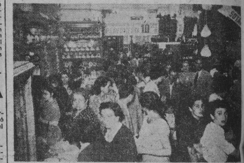
ALMACENES CAPITOLIO es la casa que vende más barato de Barcelona. A todas horas el público invade sus naves en busca del objeto del artículo que precisa, pues sabe de antemano que allí ha de encontrar las mayores ventajas en precios y calidad. El personal femenino y masculino de ALMACENES CAPITOLIO se desviven por atender y complacer a la siempre numerosa clientela.

"VIJES MELIA, S. A." Titulo 8 Grupo A. Organización Española de Viajes. Casa Central: Valencia, Paz, 41. Teléfonos 14520 28 29. Filiales: Lisboa, Plaza Rossio, 50. Tel. 31125-27. Méjico, Avenida Juárez, 91. Tel. 10 35 53. Sucursales: Alicante, Rbla. Méndez Núñez, 3. Tel. 3034. Barcelona, Paseo de Gracia, 6. Tel. 21 63 88. Bilbao, Gran Vía, 4. Tel. 16146. Coruña, Cantón Grande, 2. Tel. 4432. Granada, Gran Vía Colón, 2. Tel. 2728. Madrid, Plaza Callao, 3. Teléfono 31 10 00. Oviedo, Uria, 12 (par-