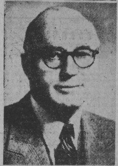
Se encuentra en la capital de España el famoso financiero y hombre de negocios norteamericano Mr. Floyd B. Odium...