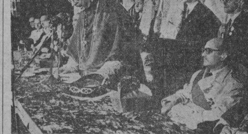
El arzobispo de Valencia, doctor Olaechea, en presencia del ministro de Educación y otras personalidades, durante su discurso en dicho acto de clausura.