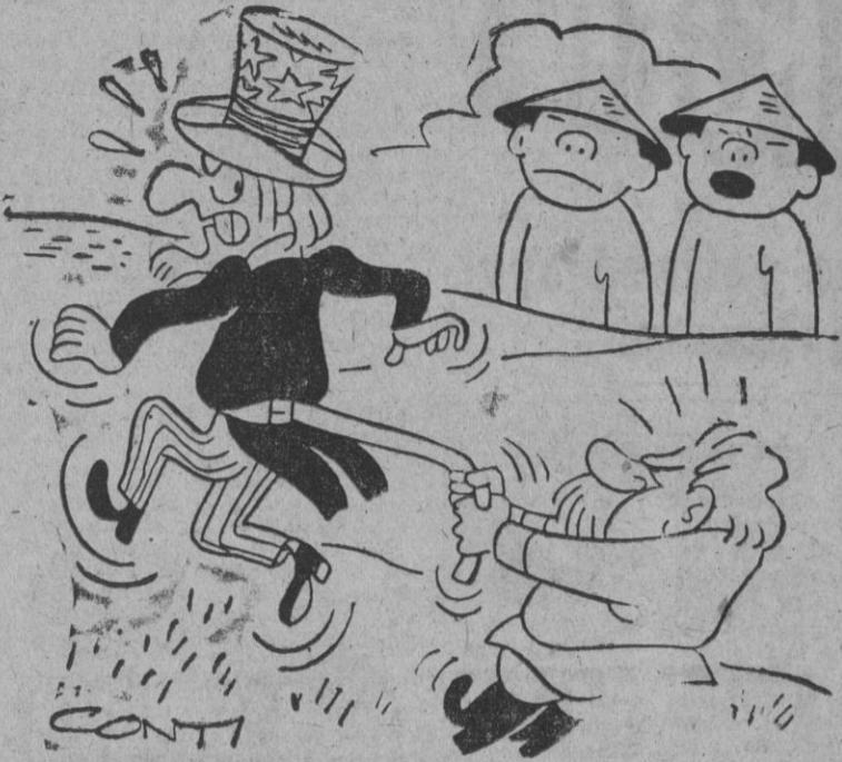
—¿Qué halá el tío Sam? Ahola le tienen bien cogido por la "corea".

blo norteamericano, perplejo, confundido ante tantas retiradas, tantas disquisiciones, tanto miedo y tantas sospechas, responderá con un sentimiento de sereno alivio, lindando así en el entusiasmo".