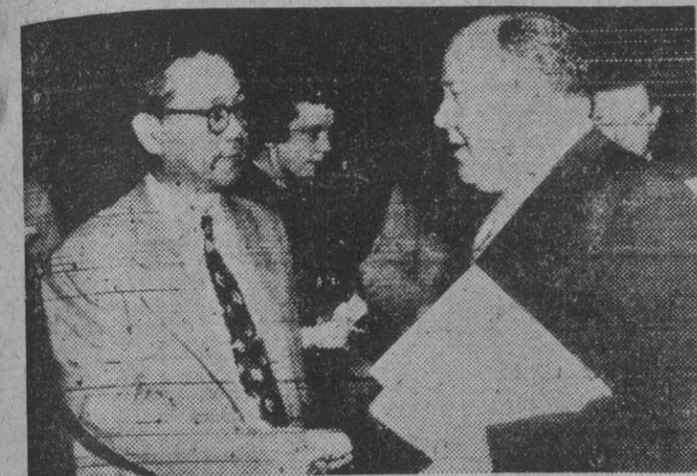
Trygve Lie, secretario general de la O. N. U., saluda al embajador de Corea del Sur, M. John Chang, a su llegada para asistir a la reunión especial del Consejo de Seguridad convocada con motivo de la agresión comunista a Corea del Sur. Rusia no asistió y Yugoslavia se abstuvo. Acordóse ordenar la retirada de los agresores.