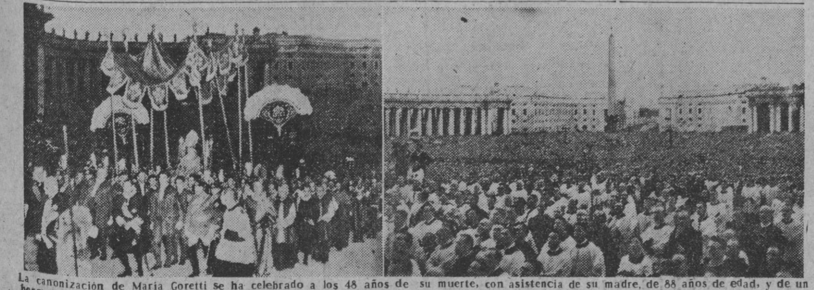
La canonización de María Goretti se ha celebrado a los 48 años de su muerte, con asistencia de su madre, de 88 años de edad, y de un acto de la canonización de la joven mártir, en presencia de más de medio millón de personas que llenaban la Plaza de San Pedro, ya ha celebrado al aire libre.