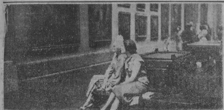
Doña Clementina Hozier y su hija Mary contemplan uno de los cuadros del Museo del Prado.

LA ESPOSA Y LA HIJA DE CHURCHILL, EN MADRID