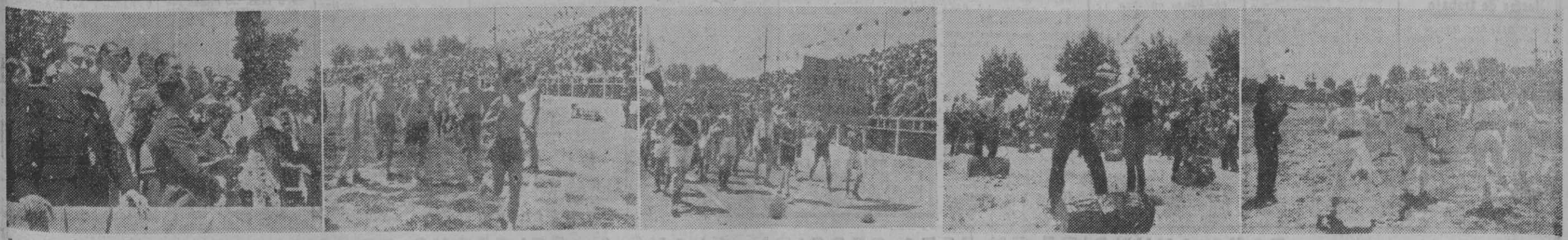
1. El Rdo. Padre Parés, capellán del Frente de Juventudes, procede a la bendición de los jugadores y sus estandartes y banderas. — 2. Un grupo de atletas encabezados por los corredores Yebra, Miran y Coll, hacen su entrada en el estadio del Guinardó, llevando la antorcha de la olimpiada. — 3. Un momento del desfile de clubs participantes en el Campeonato. — 4. Una de las fases del III Campeonato Provincial de Corte de Leña. — 5. El popular "Ball de bastons" realizado al finalizar los actos deportivos.