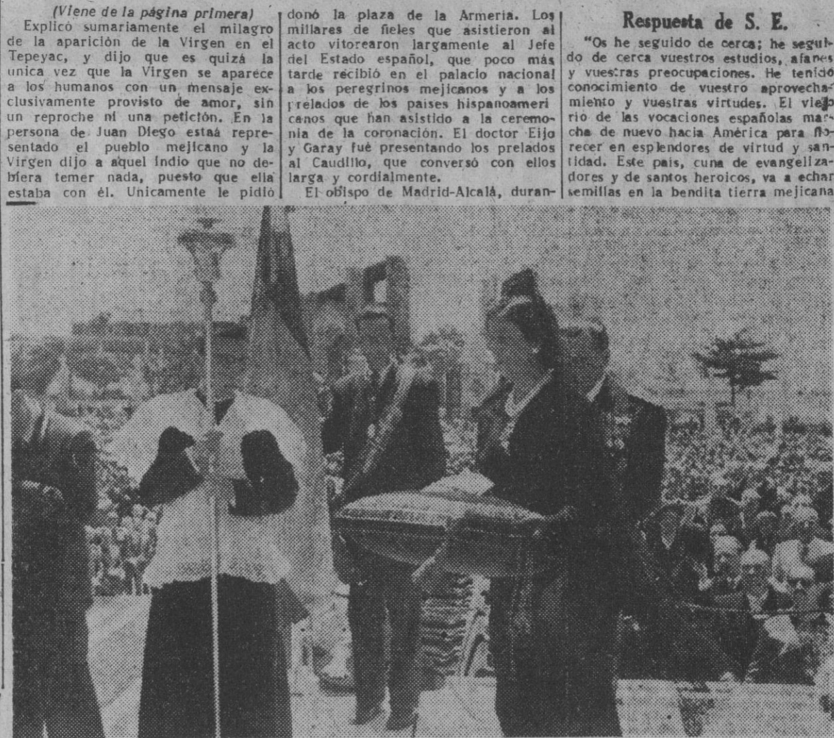
La esposa de S. E. el Jefe del Estado, ofrece al obispo de Madrid-Alcalá la corona de oro, plata y piedras preciosas para que en nombre de España se coloque sobre las sienes de la imagen de Nuestra Señora de Guadalupe, en el solemne acto de la coronación celebrada en la plaza de la Armería, con asistencia del Jefe del Estado, ministros del Gobierno, Cuerpo Diplomático y millares de fieles y peregrinos de Méjico.