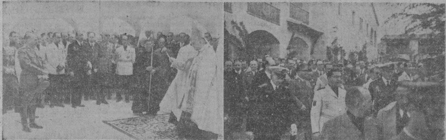
1. En presencia de S. E. el Jefe del Estado el obispo de Madrid-Alcalá procede a la bendición de la I Feria Nacional del Campo. — 2. El Generalísimo Franco recorrió las instalaciones de la Feria durante la solemne ceremonia de su inauguración oficial. S. E. saliendo de visitar los pabellones de Barcelona y Tarragona.