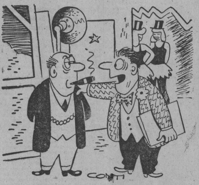
— ¿Qué le parece mi nuevo espectáculo? — Que no es una revista, es una requetevista.