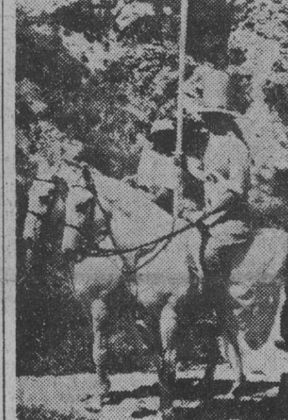
El duque de Edimburgo tomó parte en el ejercicio jocosodeportivo «Webfoot», realizado en Malta, y en el cual unidades de la Marina tomaron tierra en las playas para «recapturar» un aeródromo perdido. El duque, vestido de esta guisa — con sombrero alto y gafas oscuras — a caballo y con lanza, espera, con otros compañeros de club, rechazar a los invasores.

Todos eran viejos luchadores instruidos en la URSS