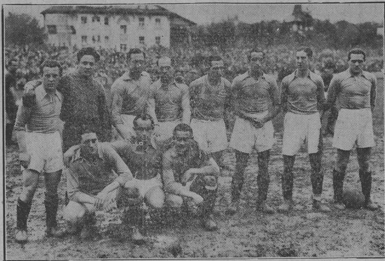
El potente equipo del Oviedo, que a pesar de realizar una gran actuación en San Juan frente a Osasuna, sucumbió ante el juego bravo y entusiasta de los "rojillos". Esta "foto" sacada a poco de comenzar el segundo tiempo, cuando Osasuna llevaba dos tan los por delante, refleja en los rostros de los ovetenses la esperanza de rehacerse en la segunda parte. Pero ya, aquello terminó con cinco a uno en favor de Osasuna.

EL JUEGO OSASUNISTA Cada uno a medida de sus fuerzas poniendo todos de su parte por conseguir vencer al adversario. Y con ganas de marcar goles, para obtener un resultado esperanzador para el porvenir. Mucho coraje en las jugadas, mucho genio para hacerse con el balón no dando un momento de respiro a los jugadores ovetenses, desde que el árbitro silbó el comienzo del partido hasta el final. Así jugó Osasuna. Qué momentos tan emocionantes eran aquellos, al ver a los rojillos defender su portería.