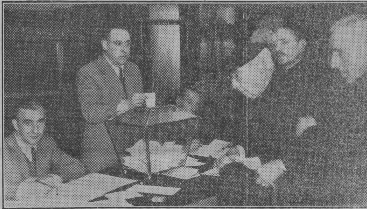
LAS ELECCIONES DEL DOMINGO.—En lo grande y en lo pequeño el ilustre y venerable Campión siempre ha puesto su esfuerzo al servicio del País, y en la foto se le ve emitiendo su voto en las elecciones del domingo, sobreponiéndose a las molestias que para ello hubo de imponerse.

Al hacer público por medio del presente BANDO que se ha declarado el Estado de Alarma en todo el territorio de la República, recuerdo que dicho estado concede a los Gobernadores atribuciones excepcionales, puesto que entre otros casos se suspenden las garantías que establecen los artículos 23, 31, 34, 38 y 39 de la Constitución, los cuales afectan a detenciones, inviolabilidad de domicilio, emisión del pensamiento y derecho de reunión y asociación. De tales facultades haré uso a medida que las circunstancias lo requieran, y ejerceré las facultades que me confiere la vigente Ley de Orden público en sus artículos 34 al 47, ambos inclusive. También hago saber que a partir de este momento queda sometida