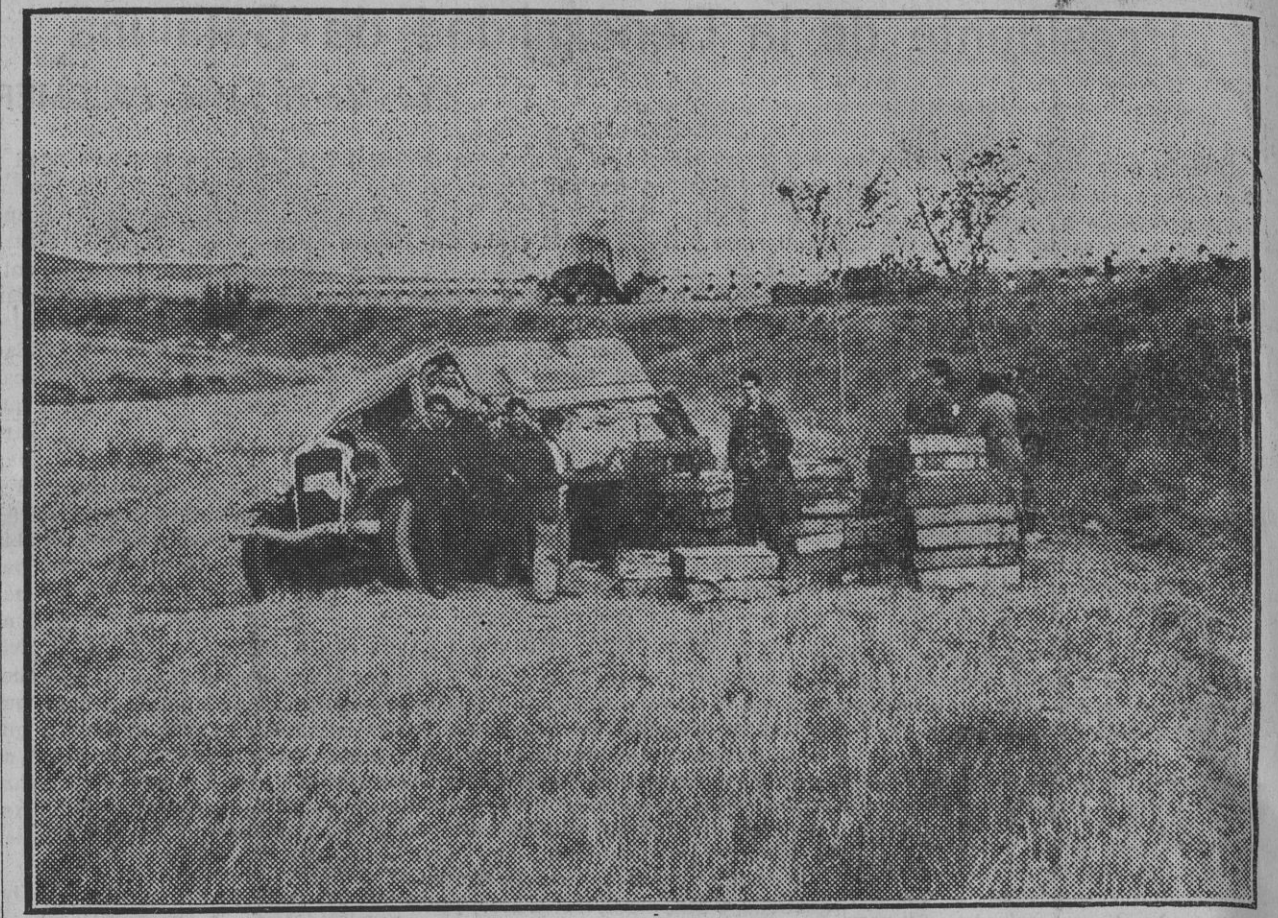
EN LAS BARDENAS.—Recientemente chocaron en plena bardena dos camiones de carga, uno con sacos de paja y otro con cajas de pescado. En la foto se ve cómo quedaron ambos vehículos.

"ANA KARENINA" su última película, es una prueba evidente de cuanto dejó dicho. He aquí la vida de una mujer hipersensible, tierna, delicada y frágil, hasta el momento de ser arrojada por la inesperada pasión de un hombre. Brava, valiente y amante, al abandonar su hogar y su hijo para entregarse a la felicidad suprema de la pasión que llenará su vida de luz. Y luego se hallará amargada, trágicamente anonadada entre la juventud